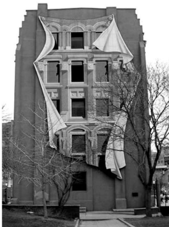
Рис. 2. Бигборд. Торонто