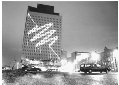
Рис. 5. Лазерное граффити. Объединение Graffiti Research Lab. Роттердам