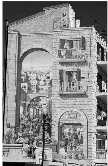
Рис. 4. Граффити. Группа художников «Cite de la creacion». Иерусалим. 2006 г.