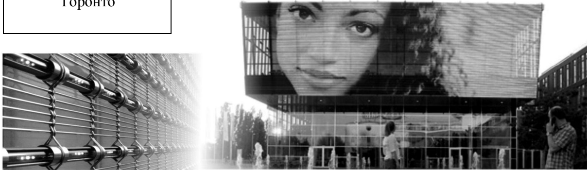
Рис. 6. Медиасетка – в основе лежит сетка с вплетенными с заданным интервалом креплениями для светодиодных трубок

Использование наложения изображения с помощью краски как средства выразительности, разнообразия и акцентировки внимания человека – это статичный вариант полихромии. Но современные технологии делают возможным динамику развития