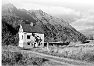
Рис. 1. Граффити. Художники Dolk и Robel. Норвегия. 2008 г.