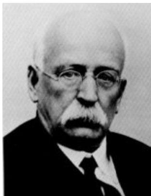
Рис.1. Эбенезер Говард (1850–1928гг.)

«созвездия» городов должно было составлять порядка 250 тысяч жителей. Радиус зоны с жилой застройкой должен был составлять примерно один километр [1]. Это обеспечивало пешеходную доступность к различным зонам, необходимым для комфортной инфраструктуры города-сада (рис. 2).