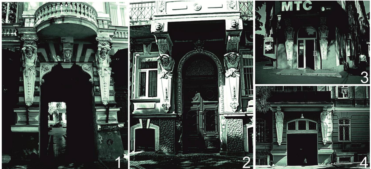
Рис. 2. Фрагменты фасадов жилых домов на ул. Гоголя, 14, ул. Преображенской, 5, ул. Преображенской, 17, ул. Щепкина, 1.