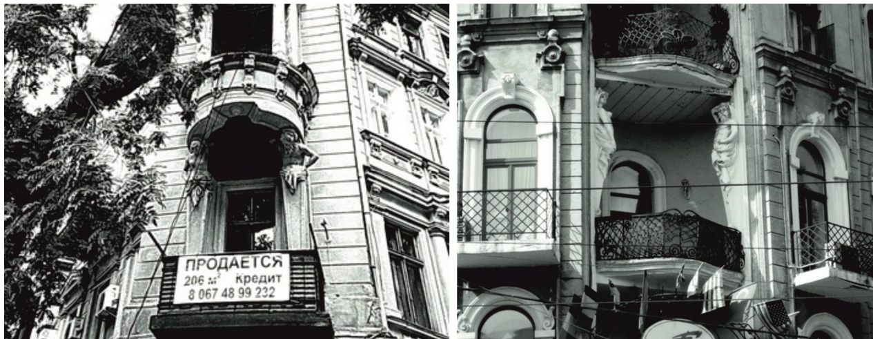
Рис. 4 . Фрагменты фасадов жилых домов на ул. Маразлиевской, 1, ул. Щепкина, 18.

Однако, атлант, являясь связующим композиционным элементом, объединяет различные уровни фасада, т. о., могут появиться и смешанные виды, такие как портально-балконные , (рис. 2), балконно-эркерные (рис. 4) и др.