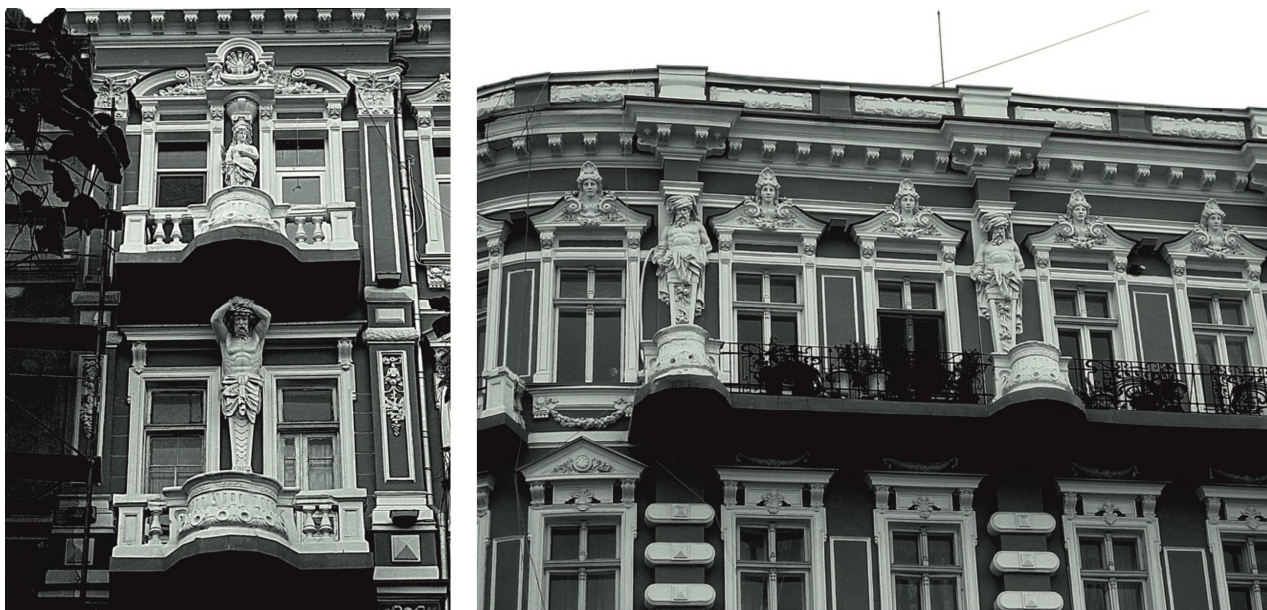
Рис. 1. Фрагменты фасада жилого дома, Екатерининская площадь, 3/4. Бывший особняк А. С. Стурдза