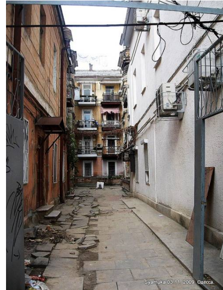
Рис. 2. Уплотнение внутриквартальной застройки в XX столетии привело к ущемлению дворовых пространств