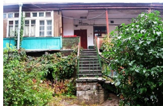
Рис.4. Многочисленные галереи и лестницы придавали дворам романтический, камерный характер.