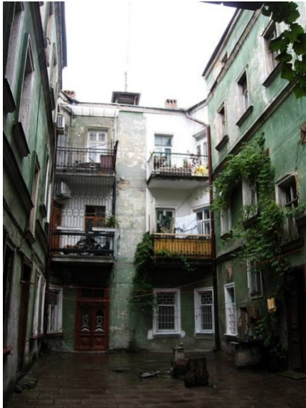
Рис. 1. В центре двора устраивались накопительные колодцы для сбора дождевой воды.