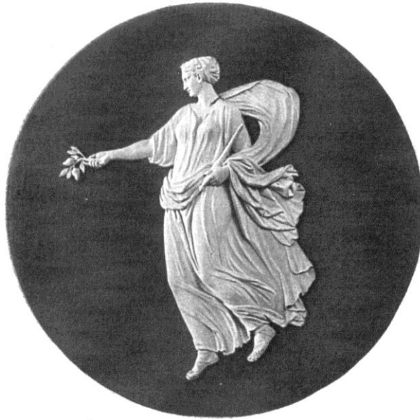
Рис.5. Медальон «Мир». Веджвуд. Конец 1770-х гг.