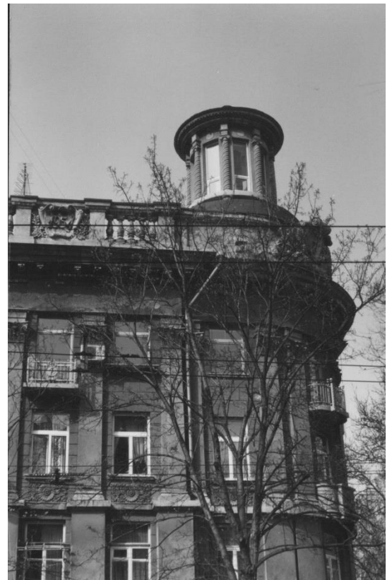
Декор подоконной плиты