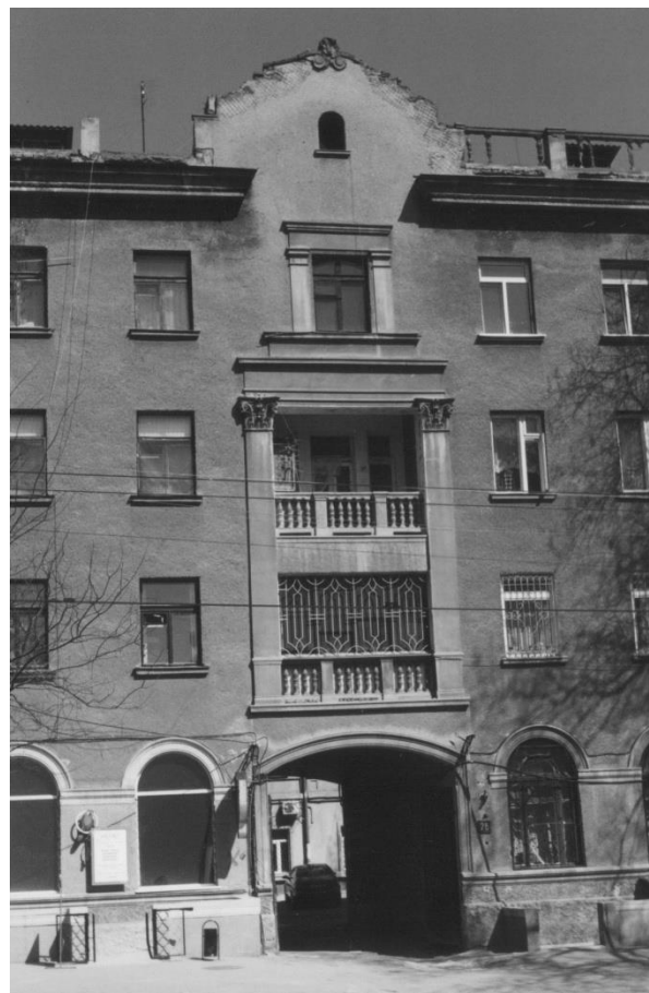
Жилой дом, арх. Е.Г. Вайнштейн, 1952 г.