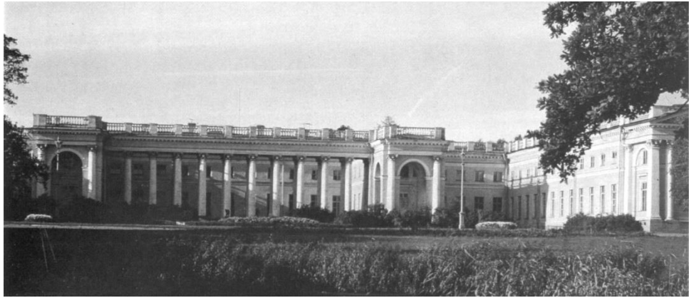
Александровский дворец в Пушкине, арх. Дж. Кваренги, 1792 г.