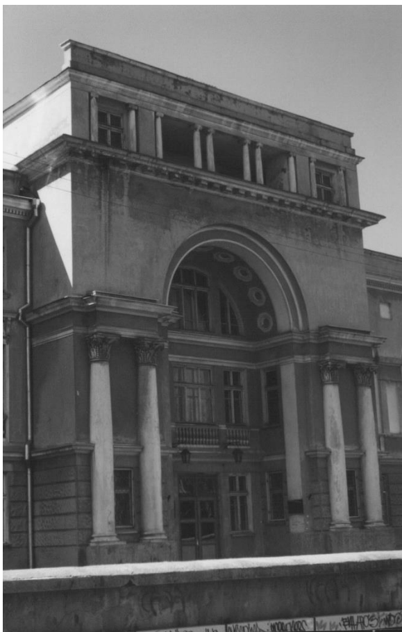
Школа им. П.С. Столярского арх. Ф.А. Троупянский, 1938 – 1939 гг.