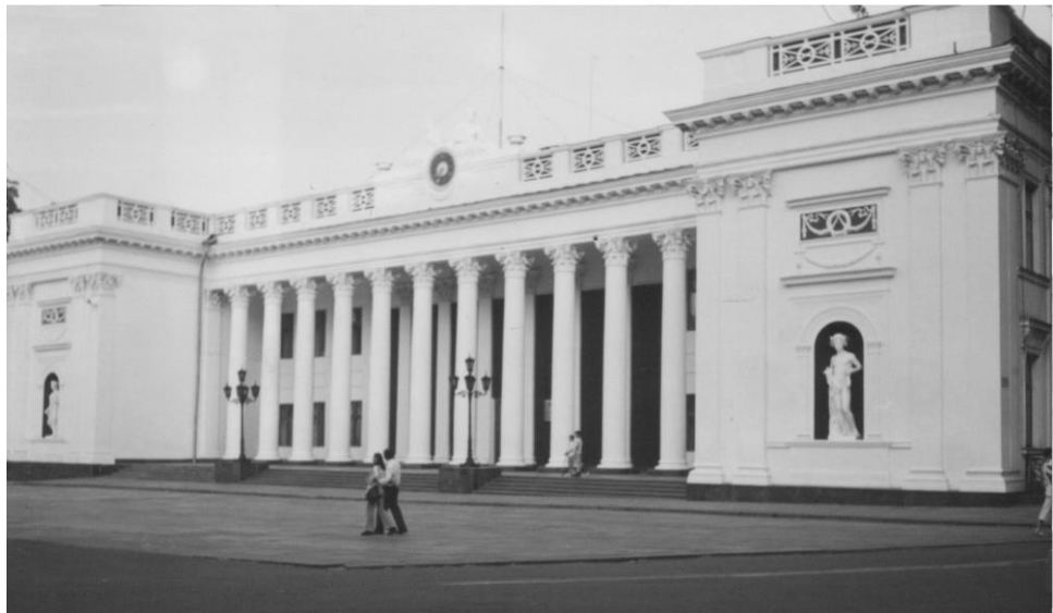
Одесса, здание старой биржи, арх. Ф. Боффо, 1829 – 1834 гг.