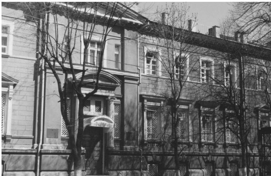
Научно-исследовательский институт курортологии и бальнеологии арх. Ф.А.Троулянский, 1937 г.

В 1937 г. по проекту архитектора Ф.А.Троулянского было возведено здание научно-исследовательского института курортологии и бальнеологии (Лермонтовский курорт). В фасадах здания использованы формы итальянского Ренессанса. Выделяется цоколь, рустованный крупными квадратами. Ризалит с главным входом лишь намечен, над входом – фронтоном лучкового профиля, покоящийся на двух ионических колоннах. Первый – главный этаж – выделен композиционно и пропорционально (он в 2 раза выше второго этажа). ©05