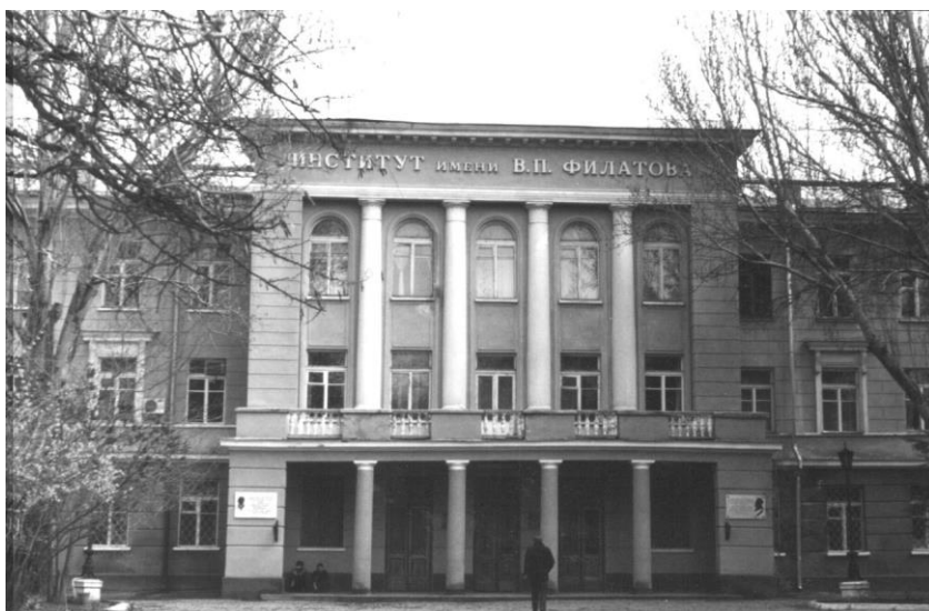
Институт им. В.П. Филатова арх. М.А. Кац, Л.Л. Кордонский, М.А. Шлифер, 1939 г.