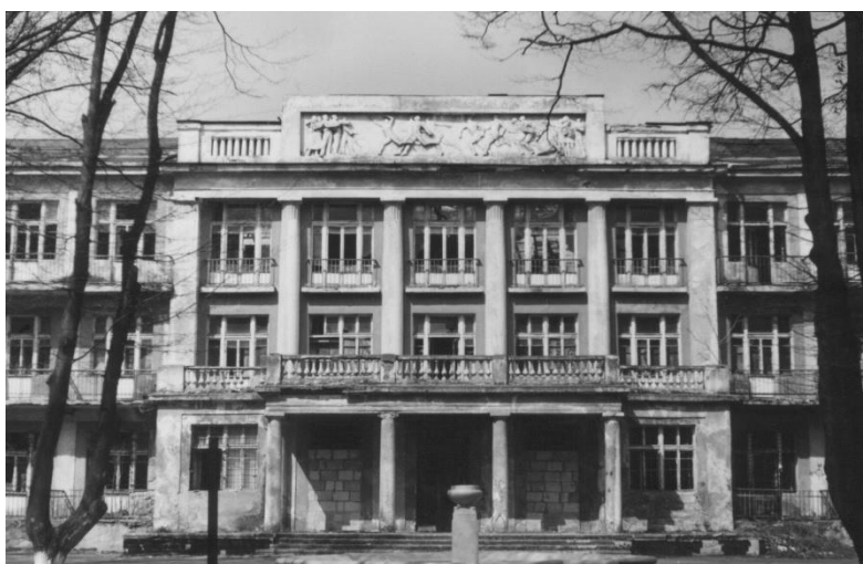
Спальный корпус санатория «Россия» арх. М.А. Кац, М.А. Шлифер, 1935 – 1939 гг.