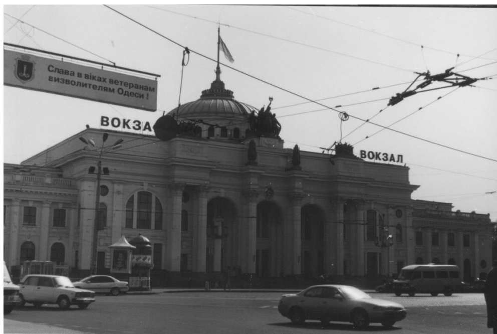
Железнодорожный вокзал, арх. Л.М. Чуприн, 1952 г.