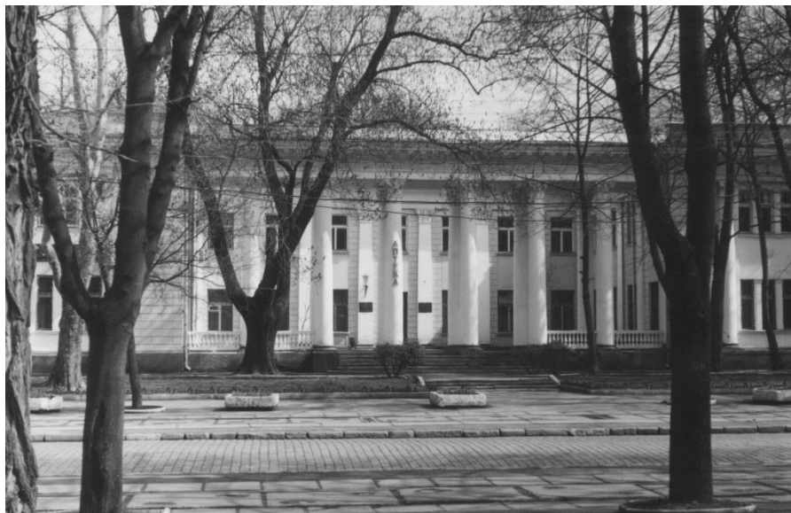
Одесса. Амбулатория Института им. В.П. Филатова, Арх. Н.Шаповаленко, Ж. Грушевская, 1952 г.