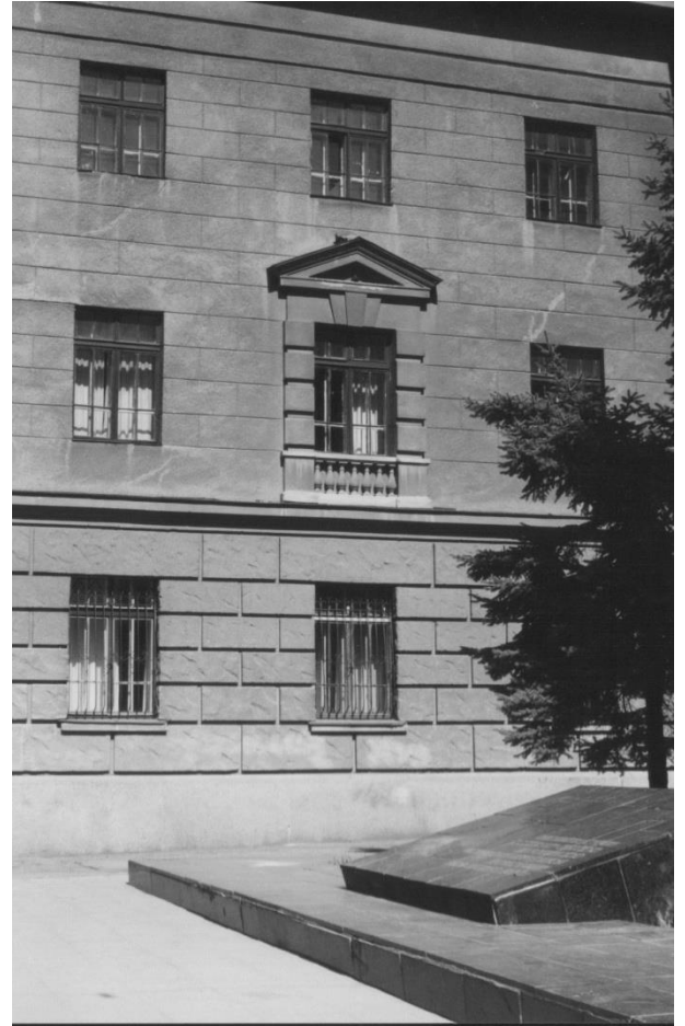
Институт связи им. А.С. Попова, арх. И.С. Брейбурд, 1952 – 1963 гг.