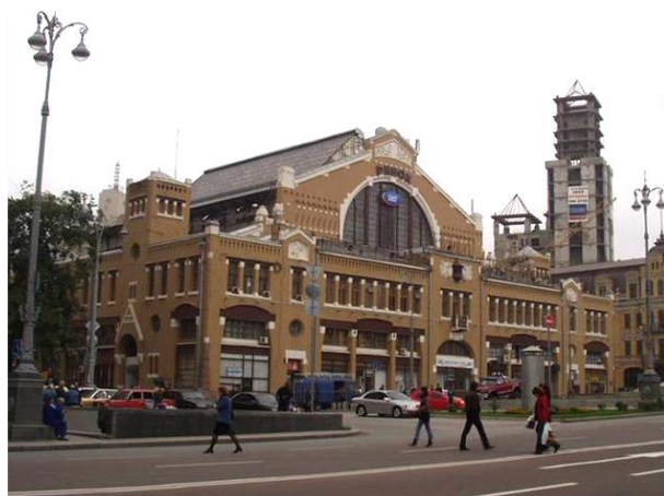
Киев. Бессарабский рынок. Арх. Г. Ю. Гай, М.П. Бебрусов. 1910