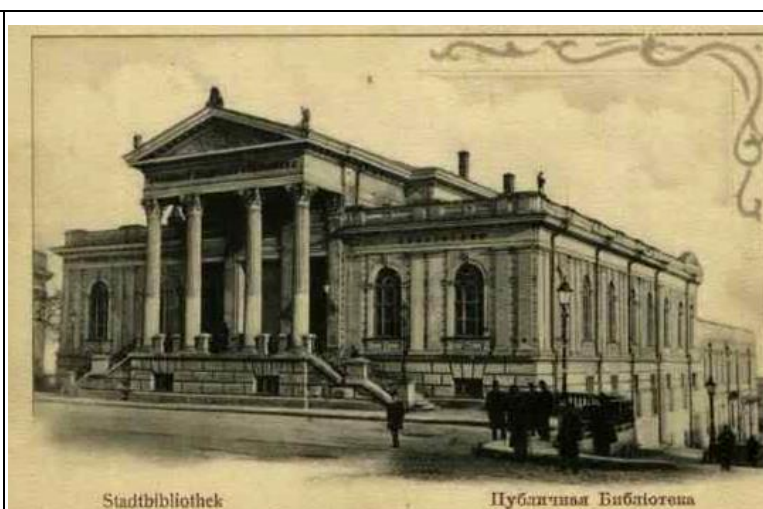
Одесса. Археологический музей Арх. Ф.В. Гонсиоровский. 1883.