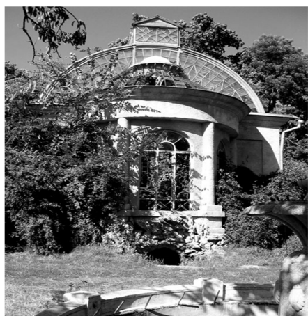
Рис. 5. Центральный павильон оранжереи