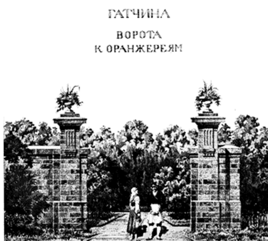
Рис. 3. Ворота парка в Гатчине [4]