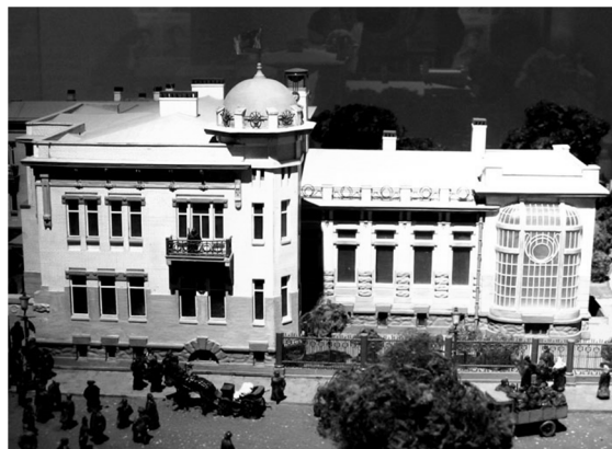
Рис. 2. Фото с макета (авторов)