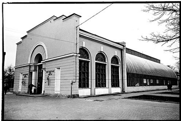
Рис. 1. Оранжерея на углу Шпалерной и Потемкинской ул. в С.-Петербурге [1]