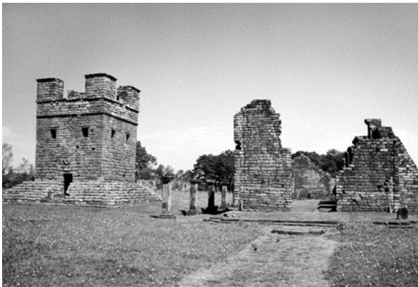
Рис. 9. Миссия Тринидад (Парагвай). Смотровая башня-колокольня