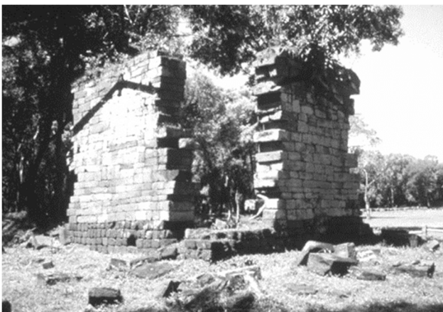
Рис. 5. Миссия Санта Анна (Аргентина). Фасад главного храма