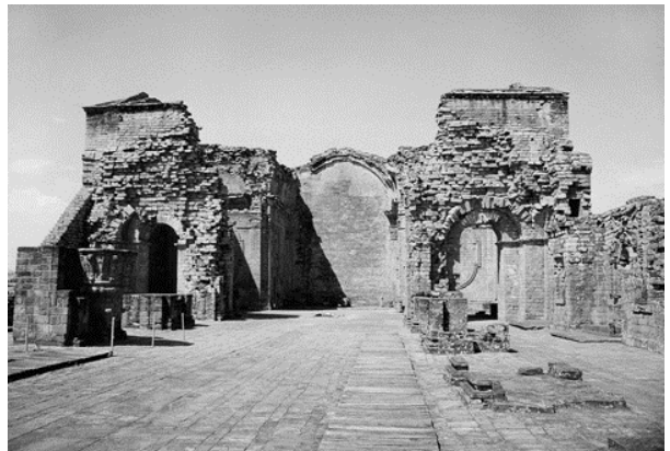
Рис. 10. Миссия Тринидад (Парагвай). Интерьер церкви