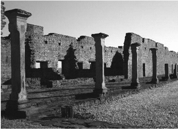
Рис. 7. Миссия Хесус (Парагвай). Колоннада галереи