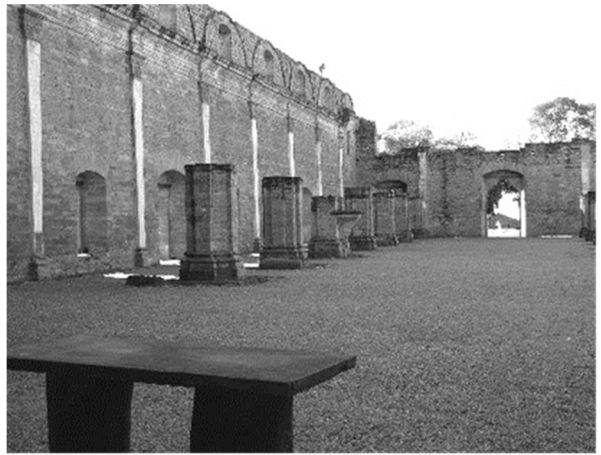
Рис. 8. Миссия Хесус (Парагвай). Интерьер главного храма