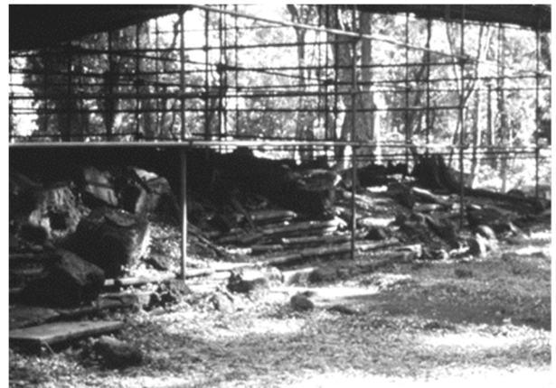
Рис. 4. Миссия Лорето (Аргентина). Ступени перед входом в церковь