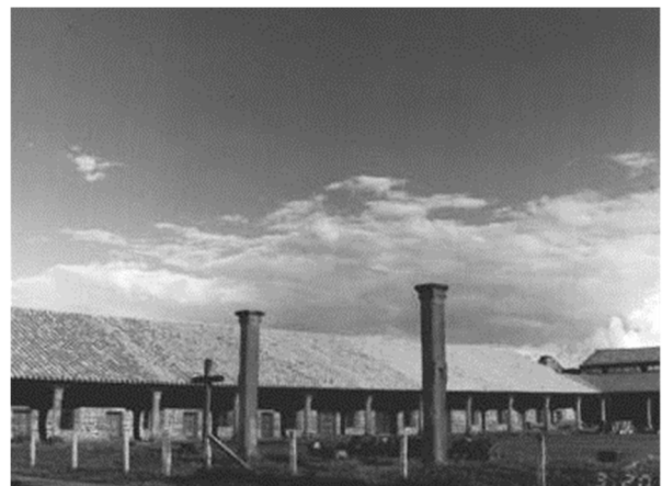
Рис. 6. Миссия Сан Космэ и Дамиан (Парагвай). Фрагмент колоннады