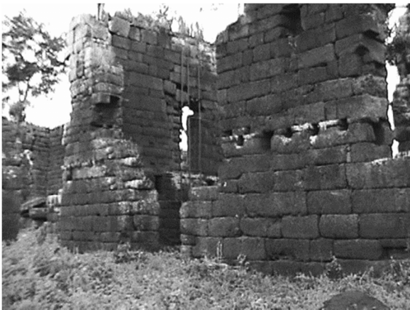
Рис. 3. Миссия Канделария (Аргентина). Стена храма