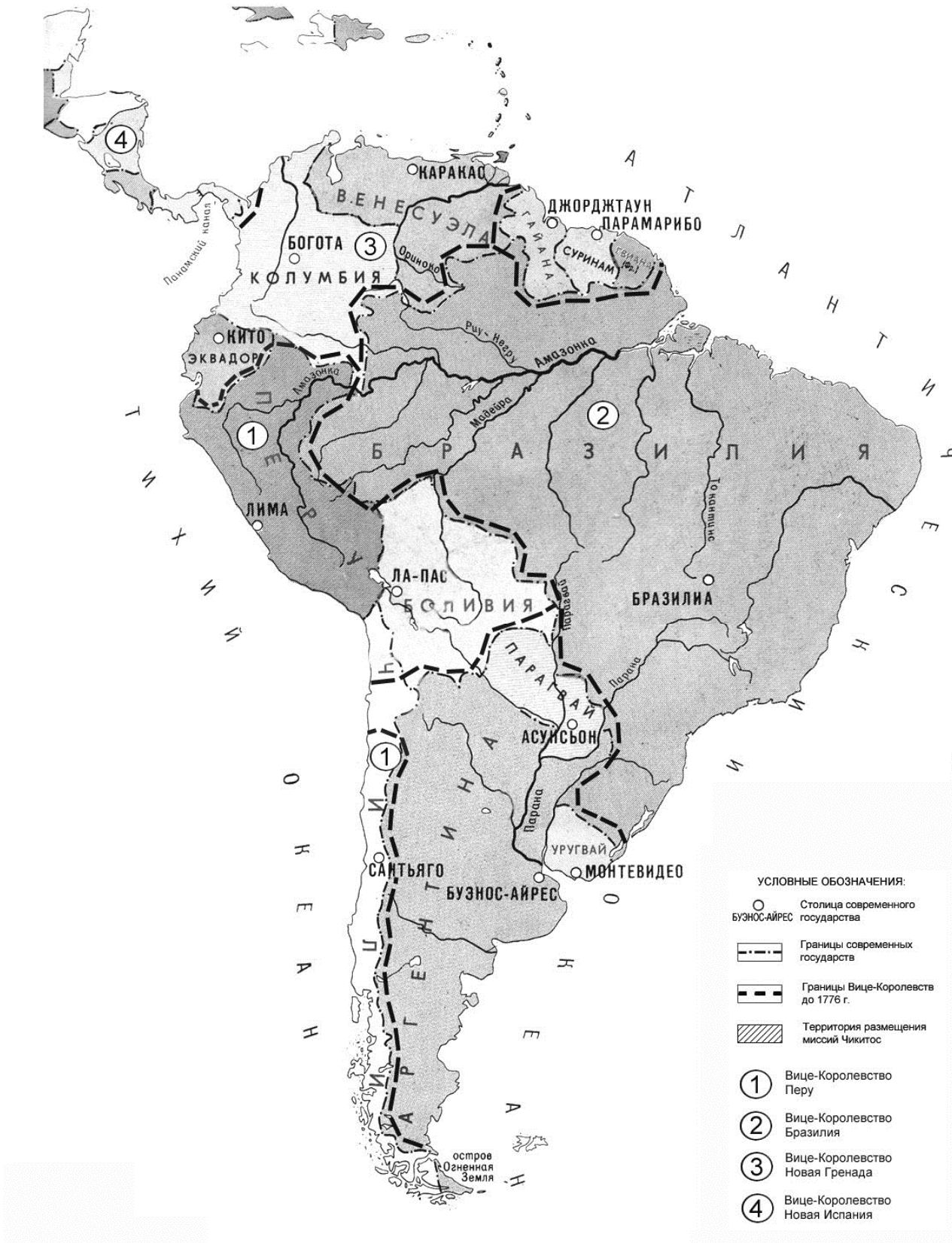
Рис. 1. Карта размещения миссий в Южной Америке в колониальную эпоху