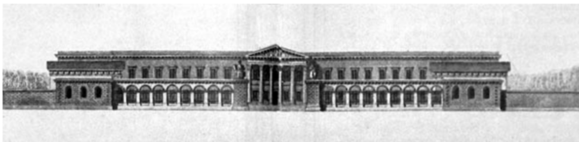
Рис.4 Проект здания Ришельевского лицея. Архитектор Монферан. Проект не был осуществлен.