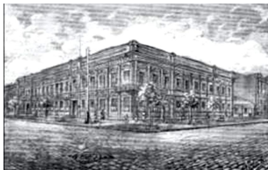
Рис.6 Первая гимназия (Ришельевская) 1865 г.