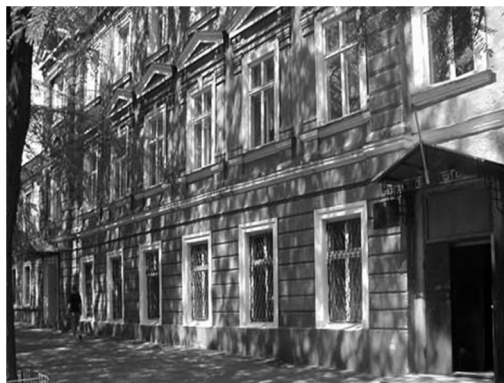
Рис.2 Ришельевский лицей. Фото 2007 г.