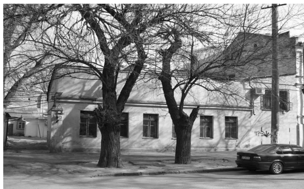
Рис.5 Вторая мужская гимназия. 1874 г.