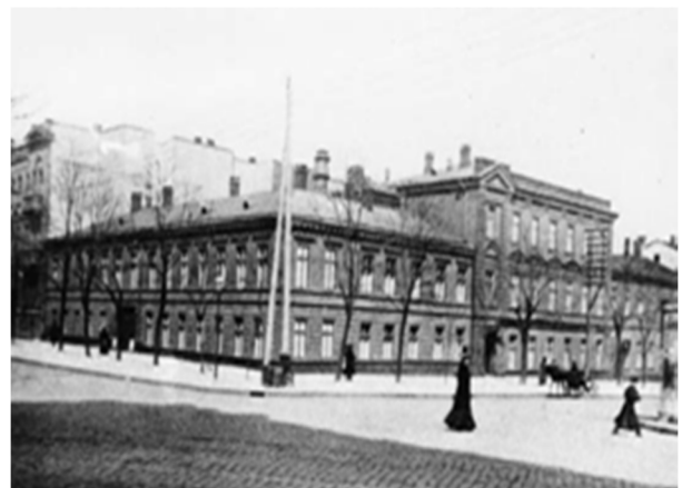
Рис. 11 Коммерческое училище Файга. 1884 г.