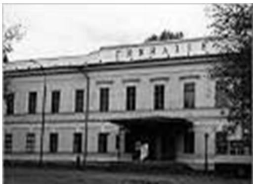
Рис.1 Коммерческая гимназия. 1804 г.