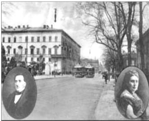
Рис.7 Одесская женская гимназия. 1864 г.