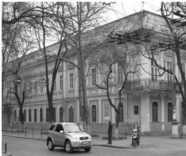
Рис.8 Мариинская гимназия