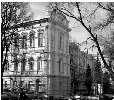
Рис.10 Пятая гимназия.