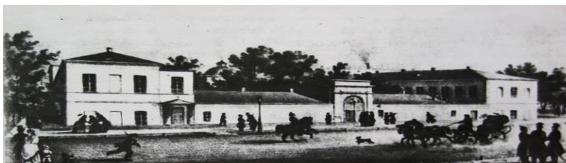
Рис.3 Ришельевский лицей 1817 – 1837 гг.