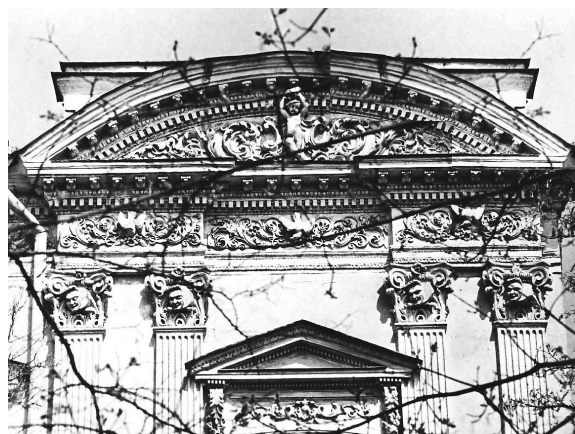
Дворец Абазы. Фрагмент эркера. Фронтон.

Во второй половине XIX в. самым массовым типом зданий в городской застройке стал многоквартирный доходный дом. В 1870 – 1890-х гг. в архитектуре жилых домов становятся популярными стилизации, выполненные на основе форм и мотивов Ренессанса и барочной пластики. Фасадные композиции приобретают живописный характер, возрастает роль скульптуры, появляется много массивных деталей: куполов, эркеров, башен. Подчёркнутой монументальностью и «барочностью» форм отличаются фасады доходных домов Руссова (1897г., арх. Л.М.Чернигов и В.И.Шмидт) и Либмана (1888 – 1889г., арх. Э.Я.Меснер при участии арх. А. Ниеса[3]). Многочисленные и разнообразные декоративные детали украшают фасад дома Руссова, выходящий на Соборную площадь: горизонтальный руст, трёхчетвертные колонны, вычурные наличники, маскароны. Центральная часть здания, акцентированная ризалитом с глубокой лоджией и раскрепованным фронтоном, венчается куполом с фонарём. Композиция фасадов дома Либмана - характерный пример фасадной композиции доходных домов историзма (обилие декора, акцентирование каждого элемента). Количество элементов декора, покрывающих фасад здания, возрастает на верхних этажах. Завершаются фасады аттиком с балюстрадой и скульптурой, угол здания подчёркнут эркером.