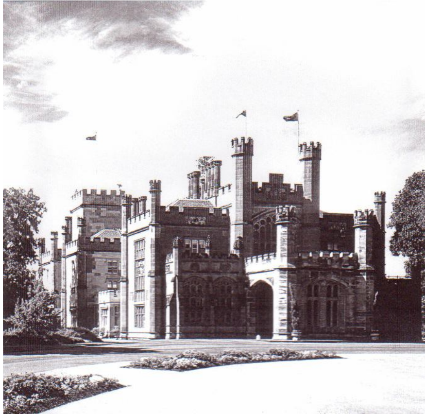
Рис.3 Дворец губернатора (Government House) в Сиднее. Современный вид.