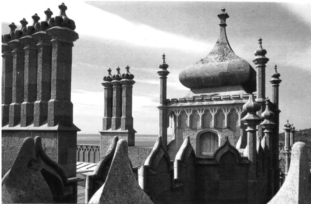
Рис.5 Дворец князя М.С. Воронцова в Алушке (1830-1848 гг.)