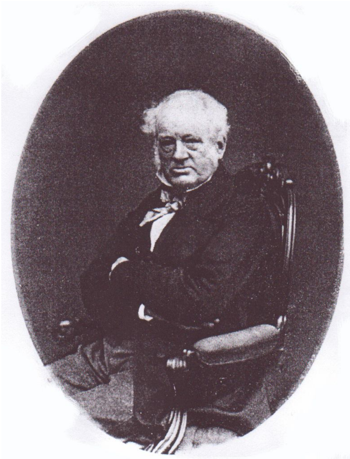
Рис.2 Архитектор Эдуард Блор (1787-1879) в возрасте 88 лет.