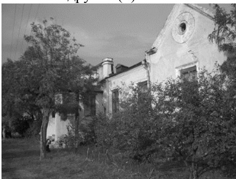
Рис. 2 Усадьба Н.Д. Кузнецова в Степановке

Еще одним примером из сохранившихся до наших дней усадеб в Одесском регионе является дом художника Николая Дмитриевича Кузнецова в его родовом имении в Степановке, которая была в 25 верстах от Одессы (рис.2). Энергетика и гостеприимство хозяина, кругозор его интересов, собирали значительное число выдающихся художников, поэтов, музыкантов в этом месте. Здесь бывали - И.Репин, В.Поленов, Врубель, Ф.Шаляпин и многие другие (7).