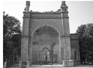
Рис. 1 Усадьба Курисово

Иван Курис занимался не только собирательством, общественной деятельностью - председатель одесского дворянства, но и вел научную работу. Его поиски в области садоводства, лесоводства и разведения пород овец были отмечены медалями на Одесской земской сельскохозяйственной выставке 1875 г. (6).