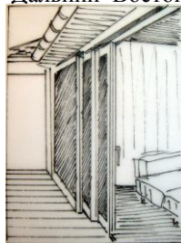
Рис. 4 Раздвижные перегородки