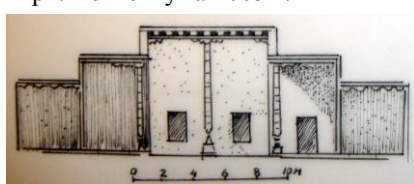
Рис. 2.1 Айван. (Ближний и Дальний Восток). Разрез.