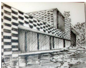
Рис 1. Дом воды и стекла. (экстерьер) Арх. Кенго Кума 2005г.

4. Минервин Г. Б., Шимко В. Т. Основные положения. Виды дизайна. Особенности дизайнерского проектирования мастера и теории. 2004.-. 188 с.