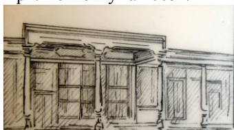
Рис. 2 Айван. (Ближний и Дальний Восток). Общий вид.