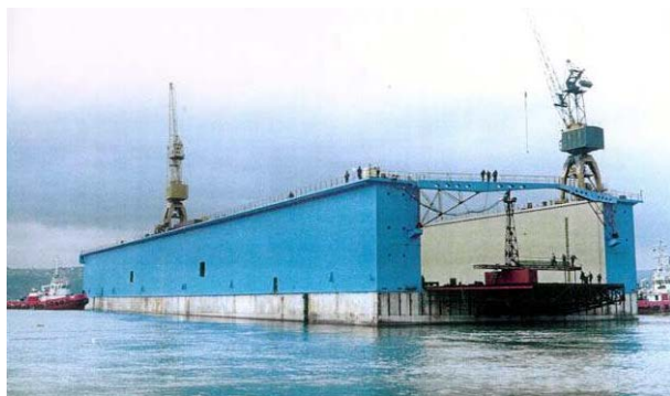
Рис.3. Плавучі залізобетонні споруди.

а – готель «Баккара», б – композитний плавучий док