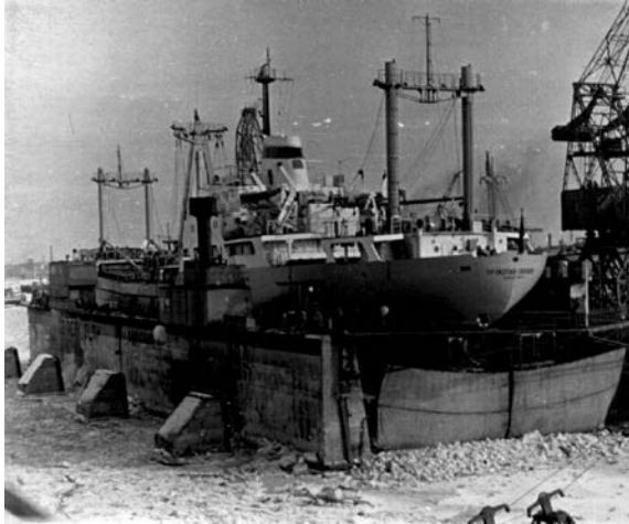
Рис.2. Експлуатація плавучого доку у зимовий період

В Україні теж є позитивний досвід будівництва керамзитобетонних плавучих споруд. У 60-ті і 70-ті роки минулого століття на заводі залізобетонного суднобудування «Паллада» були побудовані кілька керамзитобетонних плавучих доків [10]. Обстеження даних плавучих споруд показали довговічність конструкцій з керамзитобетону при експлуатації в різних, зокрема суворих умовах (рис.2) [11]. Більшість цих доків експлуатується і сьогодні [12].