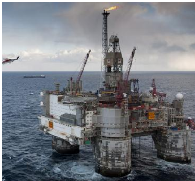
Рис.1. Плавуча нафтова платформа Heidun. Побудована з легкого бетону класу LC-60

Високоміцний пористий керамічний заповнювач використовувався для виробництва бетону при будівництві плавучих нафтових платформ [5, 6]. Зокрема, з легкого бетону класу по міцності LC-60 збудована плавуча нафтова платформа Heidun, яка працює в норвезькому секторі Північного моря (рис.1) [7]. Бетони на пористих заповнювачах показали високу довговічність в суворих умовах експлуатації у водах з сульфатами і хлоридами та при дії заморожування і відтаювання [8]. Є позитивний досвід будівництва керамзитобетонних плавучих доків і в Україні на заводі залізобетонного суднобудування «Паллада» (м. Херсон) [9].