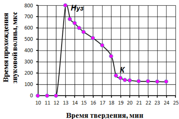
Рис. 2 Определение сроков схватывания полистиролгипсобетона ультразвуковым методом

замедлителя схватывания) наступает на 13 минуте, что в принципе достаточно для технологических целей.