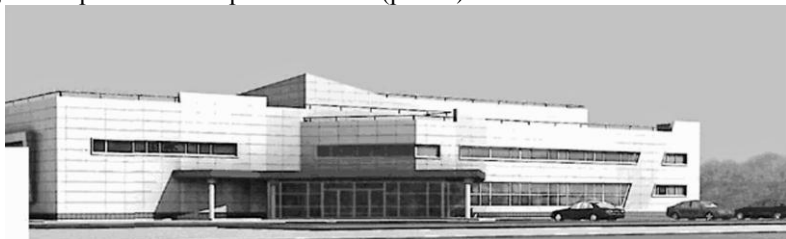
Рис.4. Специализированный физкультурно-оздоровительный комплекс для занятий спортом людей с ограниченными возможностями

Для организации занятий физической культурой и спортом лиц с ограниченными физическими возможностями здоровья требуются специализированная спортивная база (рис.4).