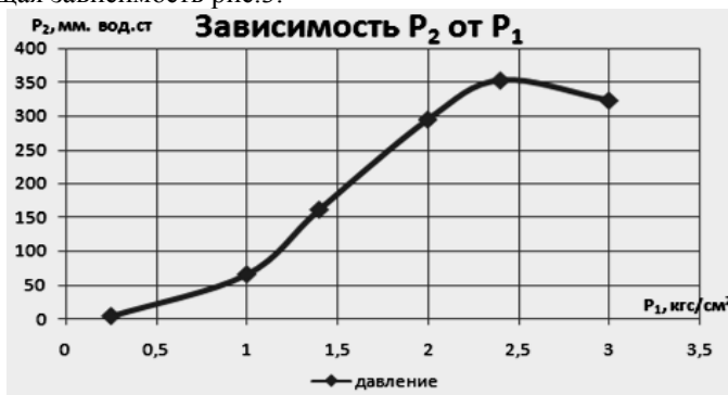
Рис.3. Зависимость выходного давления от давления на входе

На экспериментальном стенде рис. 1 были проведены исследования. На основании полученных данных была построена следующая зависимость рис.3.