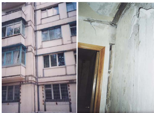
а) наружный разрыв стен, б) внутренний разрыв стен