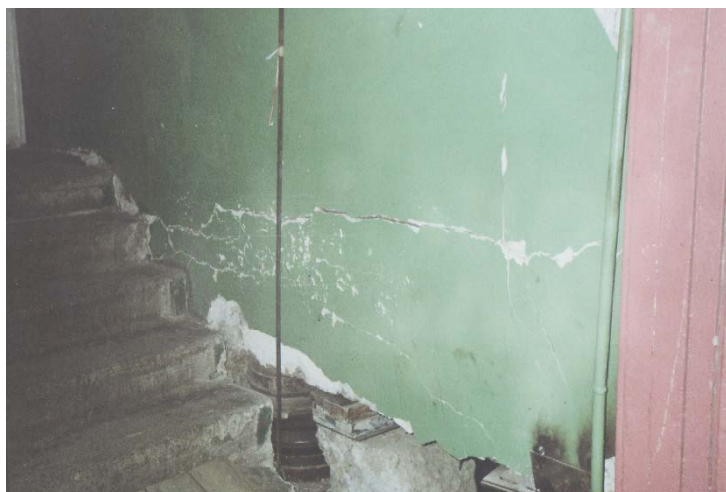
Рис. 2 Выравнивание здания с помощью домкратов

Работы по заделке стыков, щелей выполняются чаще всего некачественно из-за ограниченного пространства. В таких условиях необходимо использовать специальные, малогабаритные, не большой массы транспортабельные сборно-разборные устройства, которые бы обеспечивали высокое качество и надежность соответствующих отдельных конструкций и зданий в целом.