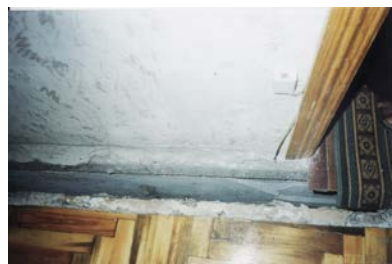
а) щель в стеновом ограждении б) сквозная щель в плитах перекрытия