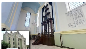
Рис. 1. Дрогобицька синагога - одна з найбільших у Східній Європі - віднедавна доступна онлайн: її можна відвідати за допомогою 3D-туру.

4. Нові підходи до освіти. Онлайн-курси та вебінари - можливість вивчення єврейських текстів і традицій через інтернет, що робить освіту доступною для ширшої аудиторії. Інтерактивні додатки - програми та додатки, що допомагають у вивченні Галахи і Тори, з можливістю участі в обговореннях і завданнях. (Рис. 1-4)