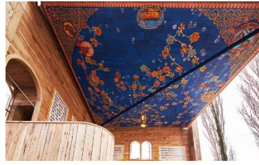
Рис. 4. На території Бабиного Яру у Києві побудували синагогу у вигляді книги

Наступні ініціативи можуть допомогти зберегти і розвинути єврейську ідентичність у мінливому світі.