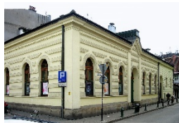
Рис. 2. Центр єврейської культури (Краків)