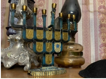
а) Підсвічник на свято Хануки