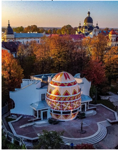
Рис. 2. Музей писанкового розпису, Івано-Франківська обл., м. Коломия

сприйняття і вивчення експонатів та умов зберігання колекцій. Архітектурно-просторове рішення побудови музею має сприяти розкриттю тематично-експозиційного задуму. Технічне оснащення будівлі повинно забезпечувати комфортний температурно-вологісний, світловий та акустичний режими для відвідувачів і збереження музейних експонатів.