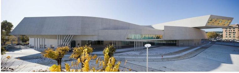
Рис. 1. Національний музей мистецтв XXI століття (MAXXI), Рим, Італія, 2009, Арх. Zaha Hadid Architects.