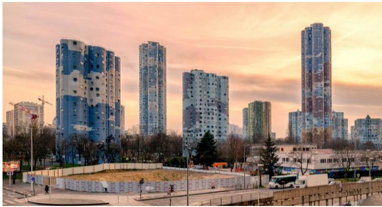
Рис. 3. Комплекс Les Tours Aillaud, Франція