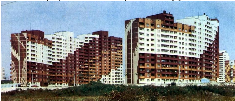
Рис. 1. Суперграфіка на будинках житлового масиву Троєщина, Київ

Одним з найяскравіших прикладів суперграфіки в Україні можна сміливо вважати житловий масив Троєщина в місті Київ. Там можна знайти 6 16-типоверхових будинків, на фасадах яких не можливо не помітити яскраві плями суперграфіки (рис. 1). Таке комплексне оформлення новозведеного мікрорайону у 1984-1986 роках розробили київські архітектори Валентин Єжов, Володимир Коломієць, Вадим Гопкало, Георгій Гуренков і художники-монументалісти Володимир Прядка й Володимир Пасивенко [1].