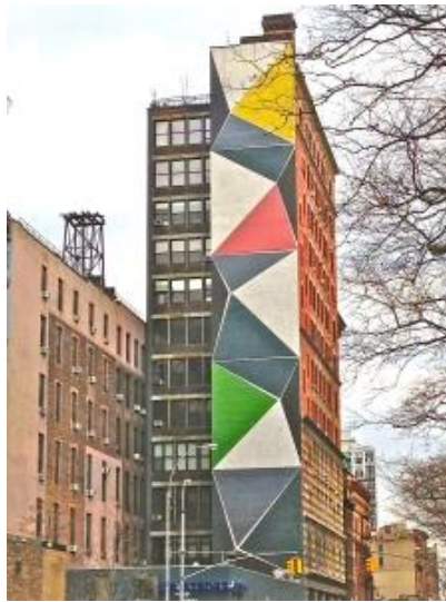
Рис. 4. Суперграфіка на фасаді будинку в Нью Йорку

Висновки. Таким чином, суперграфіка стає важливою складовою сучасної архітектурної практики, впливаючи на сприйняття та розвиток міського середовища у всьому світі та надаючи будівлям нове життя та значення. Це мистецтво не лише прикрашає простір, але й допомагає урізноманітнити громадські простори.