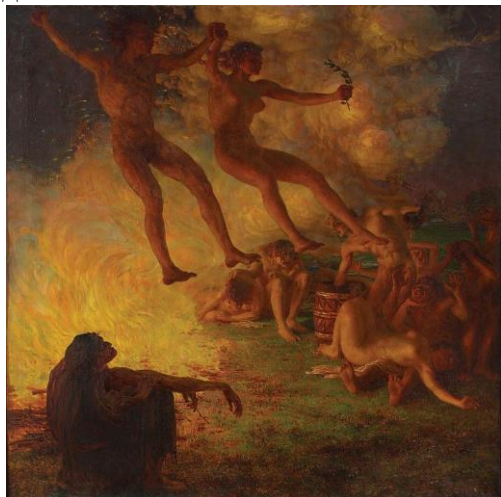
Рис. 1. Карел Вітеслав Машек, «Купало»; XIX ст.; полотно, олія

Його полотна відрізняються витонченістю ліній, насиченим яскравим колоритом, загадковістю та багатством символів.