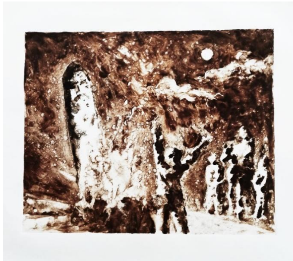
Рис. 6. «Ескіз до композиції «Жертвоприношення Перуну», 2023, монотипія олійною фарбою

Висновок. Отже, слов'янська міфологія має глибоке коріння в історії та культурі слов'янських народів, її вплив можна побачити в багатьох аспектах сучасної культури й національної ідентичності слов'ян, зокрема в художній творчості.