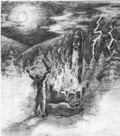
Рис. 5. «Ескіз до композиції «Жертвоприношення Перуну», 2023, папір, графітовий олівець

Опрацювання теоретичних та художніх матеріалів із розглянутої теми заклало основу для подальшого створення жанрової графічної композиції на тему «Жертвоприношення Перуну» за мотивами слов'янської міфології. Було розроблено візуальне відображення основної ідеї в ескізі до дипломної роботи (рис. 5). Також у пошуках іншого композиційного рішення був створений ескіз у графічній техніці під назвою монотипія (рис. 6). У ескізах відображається велич і могутність богів в очах тогочасної людини. Вогонь – виразний засіб, який психологічно захоплює людську підсвідомість і підкреслює образ, до якого звертаються віруючі.