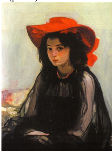
Рис. 1. Олександр Мурашко. «Дівчина в червоному капелюсі», 1903 р.

Роль кольору в творчості відомих художників. Для художника-колориста важливі принципи гармонійного поєднання кольорів між собою, яке дозволяє створити певний настрій картини, передати власні відчуття та емоції глядачу. Велику увагу колориту своїх полотен приділяв французький художник-фовіст Анрі Матісс. Митець вважав, що колір здатний справляти набагато потужніший ефект на глядача, ніж форма та інші засоби виразності в живописі. Енергійні мазки та яскраві насичені кольори стали частиною його впізнаваної творчої манери. А. Матісс звільнив колір від необхідності відповідати реальності та просто «розфарбовувати» предмети, надав йому самодостатність, наділивши великим експресивним потенціалом. Різні аспекти колориту розглядали у своїх теоретичних роботах художники Олександр Богомазов, Василь Кандинський, Жорж П'єр Сера та інші. Збереглися відомі висловлювання про силу і роль кольору в мистецтві від Костянтина Коровіна, Костянтина Юона, Пабло Пікассо, Соні Терк-Делоне. Значна роль кольору та колориту простежується в мистецтві представників українського модерну: Всеволода Максимовича, Олександра Мурашка, Олекси Новаківського, Петра Холодного. «Особливу роль відіграв колір у портретах українського модерну, де образ людини, завдяки колориту, стає не лише натуралістичним, але й декоративним» [3]. Підтвердженням цієї тези виступають, зокрема, портретні композиції О. Мурашка (рис. 1).