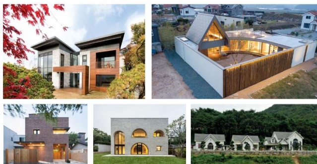
Рис. 7. Індивідуальний будинок європейського типу

На межі XX-XXI ст. Корея стрімко розвивається і стає так званим «азіатським тигром». Житлова архітектура також зазнала своїх змін. Сучасні багатоповерхові корейські житла зовні нічим не відрізняються від західних. Малоповерхові індивідуальні будинки все ще залишаються типу «керян ханок». Різниця простежується лише в інтер'єрному рішенні. Тут все ще зберігається зв'язок з традиціями.