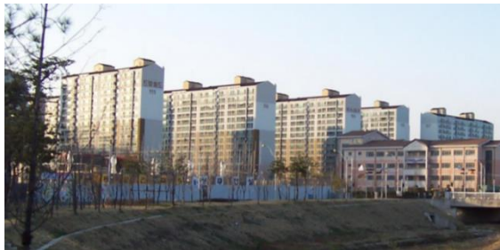
Рис. 4. Апарти

років XX ст. починає жити у будинках західного типу. Такі будинки мають кам'яні або цегляні стіни, натомість будинки традиційного типу все ще використовують конструкцію дерев'яного каркасу. Однак будинки європейського типу опалюються, як правило, ондалем. Внутрішнє планування було за західним стилем. Меблі корейської традиції мізерна, але переважають традиційні розсувні вікна і внутрішні двері. Житло будується з ванною, якої в традиційному будинку не було [5].