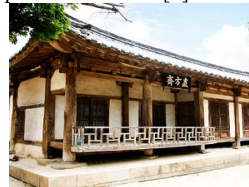
Рис. 2. Корейське житло заможного дворянина

На початку XX століття Японія завойовує Корейський півострів та перетворює його на свою колонію. Японія на той час починає стрімко розвиватися та інтегруватися по тогочасним тенденціях. У цей період урбанізація та міська міграція суттєво ускладнили житлове питання у Сеулі та інших містах Кореї. З того часу вигляд корейського житла зазнав серйозних зміни. Новий тип житла – «Керян ханок» (видозмінені традиційні житла під черепичним дахом) стали будуватися в центрі Сеула та на його околицях починаючи з 1920 р. і до 1960-х років. «Керян» у перекладі з корейської можна перекласти як «покращення», «перетворення», а «ханок» – це назва традиційного житла. Таким чином, «керян ханок» зберігає основні особливості корейського традиційного будинку і в той же час має більш покращені характеристики в плані його будівництва та експлуатації. У великих містах стали будуватися будівлі та споруди в західному та японському стилі. В цей час з'явилися перші багатоквартирні будинки, проте більшість корейців воліло жити в традиційних будинках під черепичною або солом'яним дахом [3].