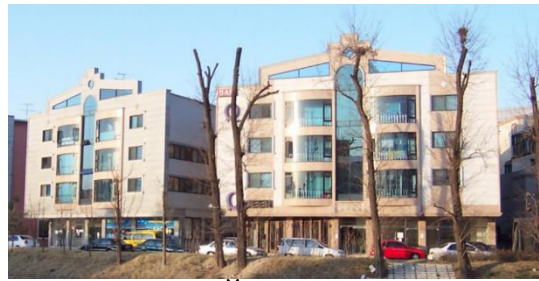
Рис. 5. Йонріп «Білла»