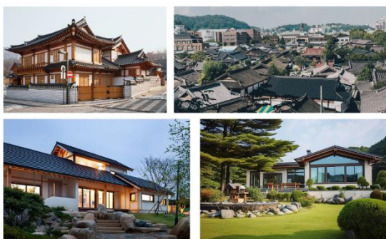
Рис. 6. Індивідуальний будинок традиційного типу