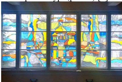
Рис. 1. Київ. Вітраж у фойє Національної академії керівних кадрів культури і мистецтва

Історія виникнення вітража є досить цікавою та сягає сивої давнини. Вони не лише прикрашали архітектурні об'єкти, але й розповідали історії та відображали духовні теми. У ХХ столітті і дотепер вітражі продовжують відігравати значну роль у світовому мистецтві, з'являючись у сучасному дизайні та архітектурі (рис. 1) [2].