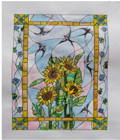
Рис. 6. Один із останніх ескізів до дипломної роботи з ластівками «Українські квіти»