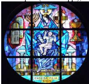
Рис. 5. Вітраж круглого вікна в церкві Санта-Марія-Маджоре у Беневенто, Італія

Ознайомившись з таким загадковим напрямом мистецтва, я дійшла до висновку, що бажаю свою дипломну роботу виконати в техніці вітраж. Розпочати свою роботу над дипломом було діло не з легких, адже потрібно було визначитися з темою, в якій можна було б передати настрій. В перегляді тем було прийнято залишитися на темі квітів – «Українські квіти». Квіти, це те, що постійно дарує посмішку, легкий настрій, чистий спокій. В даній композиції перевагу бере бажання передати легкість сприйняття, покинути ментальне навантаження та просто передати чарівність квітки соняха, як найяскравішої квітки українського поля, яка є символом світла та незламності. Перші ескізи готувалися для головного входу кафедри Образотворчого мистецтва, академії ОДАБА (рис. 6), в перевазі було бажання передати арочну композицію, над самими дверима. В ході роботи було прийняте рішення замінити головний вхід з фойє на кімнату. Тип вікна вибрали прямокутним, в композиційному рішенні було затверджено соняхи з ластівками, як символ любові та щастя (рис. 5-7).