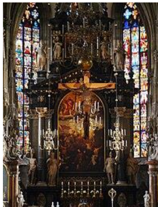
Рис. 4. Головний вітвар з видом на вітраж (1640/47 рр.), Собор Святого Стефана (Відень)

оброблення, лазерне гравіювання та цифровий друк, також застосовуються у сучасному вітражному мистецтві.