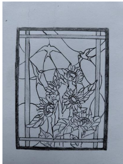
Рис. 7. Останній ескіз з ластівками до дипломної роботи «Українські квіти»

Висновки. Вітражі – це художня техніка, яка поєднує мистецтво, технології та історію вітчизняного і світового мистецтва. Вони є втіленням поєднання кольору, світла та форми, створюючи ефекти, що захоплюють увагу та дарують насолоду. Вітражі мають багатий історичний спадок, який простягається від середньовічних храмів до сучасних архітектурних чудес.