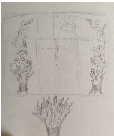
Рис. 5. Ескіз одного з композиційних рішень дипломної роботи на тему «Українські квіти»

Ознайомившись з таким загадковим напрямом мистецтва, я дійшла до висновку, що бажаю свою дипломну роботу виконати в техніці вітраж. Розпочати свою роботу над дипломом було діло не з легких, адже потрібно було визначитися з темою, в якій можна було б передати настрій. В перегляді тем було прийнято залишитися на темі квітів – «Українські квіти». Квіти, це те, що постійно дарує посмішку, легкий настрій, чистий спокій. В даній композиції перевагу бере бажання передати легкість сприйняття, покинути ментальне навантаження та просто передати чарівність квітки соняха, як найяскравішої квітки українського поля, яка є символом світла та незламності. Перші ескізи готувалися для головного входу кафедри Образотворчого мистецтва, академії ОДАБА (рис. 6), в перевазі було бажання передати арочну композицію, над самими дверима. В ході роботи було прийняте рішення замінити головний вхід з фойє на кімнату. Тип вікна вибрали прямокутним, в композиційному рішенні було затверджено соняхи з ластівками, як символ любові та щастя (рис. 5-7).