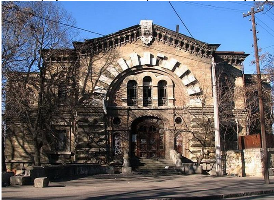
Рис. 2. «Масонський будинок» до руйнування

1957 року тут знаходилася хімічна лабораторія, з 1957 по 1977 – НДІ «рідкісних металів», після цього аж до 1995 року – «дослідний завод фізико-хімічного інституту» [2].