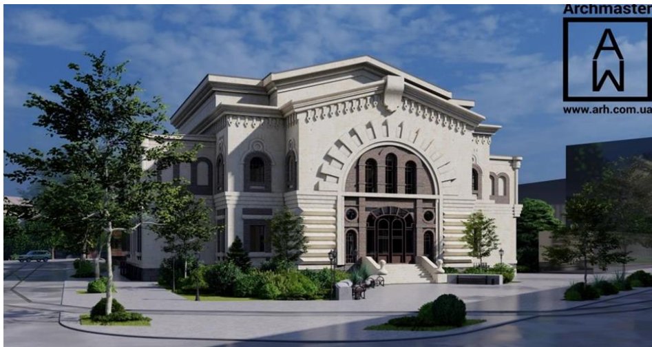
Рис. 4. Проект перебудови «Масонського будинку». Автор Олександр Горбачов. Студія «Arhmaster»

Причиною руйнування споруд, які згадані вище є в першу чергу природне старіння, недоліки утримання та експлуатації. Але в наш час з'явився один жажливий фактор – атаки цивільних будівель війсьним шляхом. Вночі 23 липня 2024 р. внаслідок обстрілу Одеси загинула одна людина, 22 поранено. Також були пошкоджені будівлі і пам'ятки архітектури. Серед них і головний православний храм міста Спасо-Преображенський собор (рис. 5).