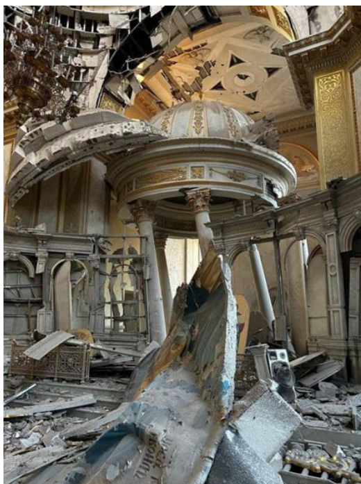
Рис. 6. Пошкоджений вітвар Спасо-Преображенського собору

Висновки. У роботі був проведений аналіз історії створення, особливостей експлуатації, стану, причин та рівня пошкоджень трьох історичних будівель міста Одеси. Враховуючи стан робіт над філармонією, можна з впевненістю констатувати, що її реставрація має хороші перспективи завершитися вже в цьому році. Що стосується «Масонського будинку», то в нього трохи інша ситуація: реконструкція досі лише на планувальному етапі та в останній час нема втішних новин. Можливо роботи затягнуться ще на кілька років. Планування реконструкції Спасо-Преображенського собору прискорюється завдяки підтримці італійських колег. Така значуща архітектурна пам'ятка обов'язково має бути в гарному стані, тому її повернення до нормального виду має бути лише питанням часу.