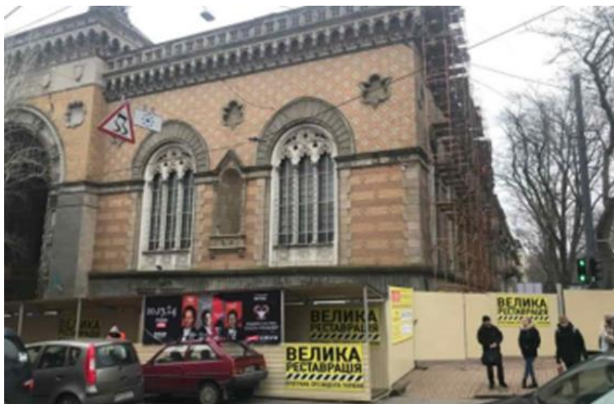
Рис. 1. Одеська обласна Філармонія

Жителі Одеси та гості нашого міста позбавлені права відвідувати концерти в місцевій філармонії, яка є видатним пам'ятником архітектури з незабутніми інтер'єрами та фасадами, стан якої потребує негайного втручання.