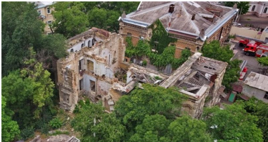
Рис. 3. «Масонський будинок» після руйнування