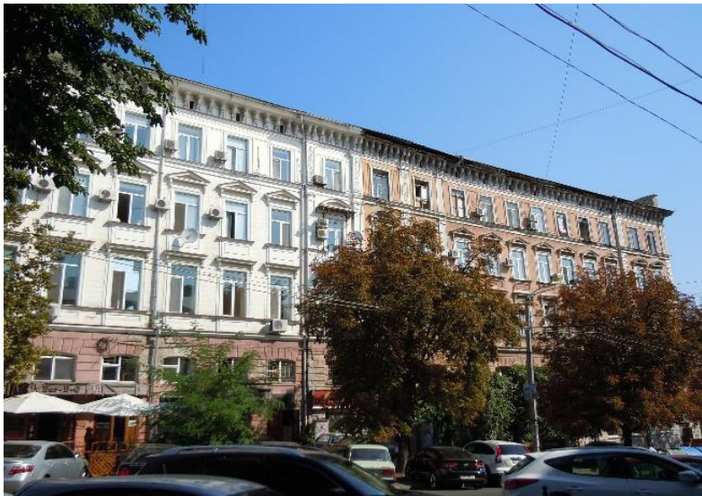
Рис. 3. Будинок Баржанського