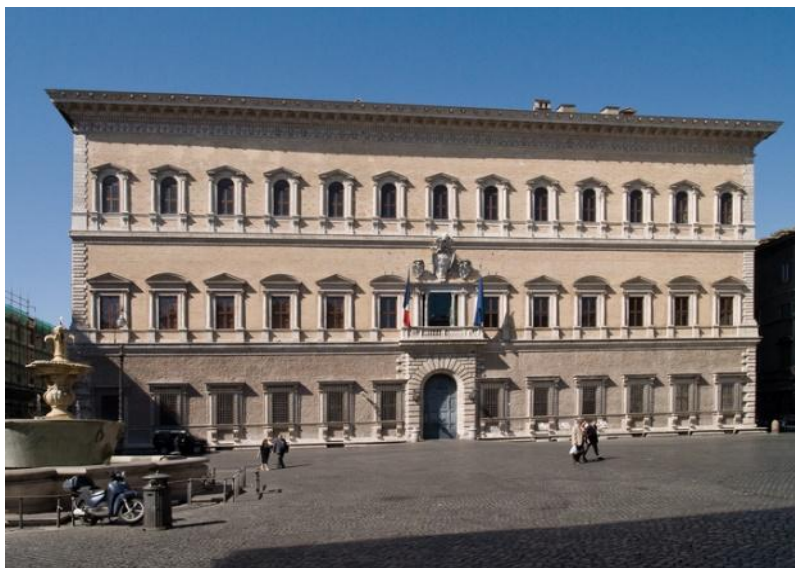
Рис. 1. Палаццо Фарнезе (1515р.)

Подібним на обох фасадах є відмінність оздоблення першого поверху від наступних. Фасадним покриттям будинку Баржанського виступає рустове каміння, так само як і в палаццо Строцці (рис. 2) (1489 р.). Карнізи обох палаццо подібні, і завершують композицію, як в будинку Баржанського, так і Шкіртресту (рис. 4). Такі карнізи мають назву «вінцевий карниз». Вони виконують функцію захисту стін будівлі від потрапляння на них крапель дощу і підтримують зв'язок покрівлі.