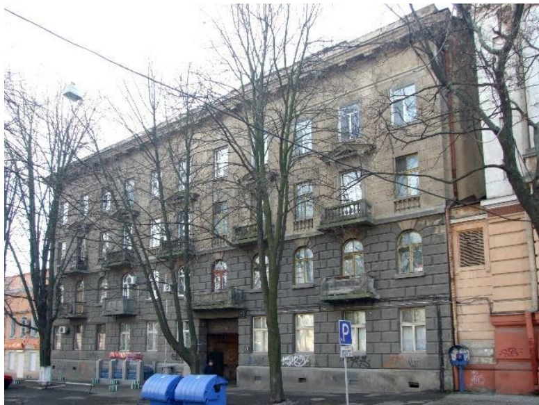
Рис. 4. Будинок Шкітресту