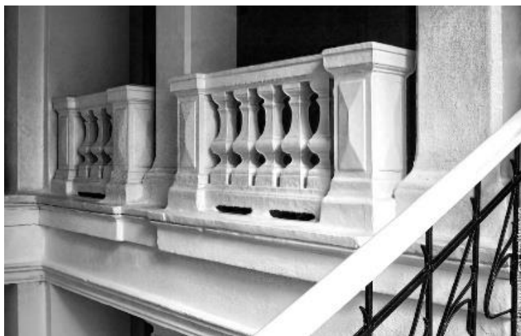
Рис. 7. Балюстради

Периметральна сходова клітка розташована на одній вісі з вестибюлем і відокремлюється від його об'єму ще однією колонадою, причому цей хід повторюється на всіх поверхах. Ліворуч від сходової клітки обладнаний прохід удвір. На сходах встановлені перила з балясинами поширеної бюджетної моделі періоду пізнього модерну, сходи виконані з мармуру. Між стовпами-колонами колонад, що розділяють сходову клітку і просторі Г-подібні коридори, що ведуть в аудиторії другого і третього поверхів, в якості огорож встановлені класичні балюстради.