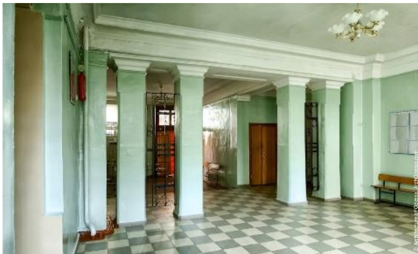
Рис. 6. Вестибюль

Даниною модерновим тенденціям в архітектурі 1910-х рр. служить ефектно округлений кут будівлі, що надає суворому, монументальному фасаді деяку пластичність і візуальну легкість. Вплив модерну, без відходження від неокласичного характеру споруди стає помітнішим в парадних інтер'єрах гімназії. Просторий вестибюль розділений надвое масивною стельовою балкою, що спирається на чотири, згрупованих по двоє, стовпи квадратної в плані форми. Майже у всю висоту їх кути зрізані, а самі вони увінчані капітелями доричного ордера.