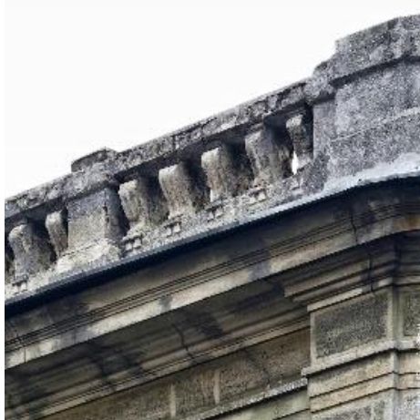
Рис. 5. Фрагмент балюстради

Ризаліт увінчується широким фризом з великими канелюрами, суворим карнизом великого виносу і химерними аттиками на крайніх вісях, центральні елементи якого вирішені у вигляді сильно геометризаних за обрисами ваз. Фасадні площини поза ризалітів завершуються кам'яними балюстрадами з сильно модернізованими балясинами.