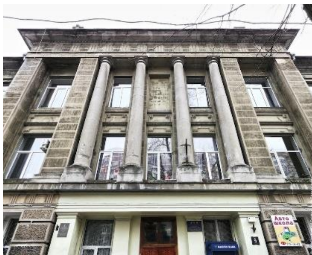
Рис. 4. Центральний ризаліт

Весь нечисленний декор зосереджений у центральному ризаліті. Вікна другого поверху на його крайніх вісях не мають лиштв, але тим не менш доповнені модернізованими прямими сандриками, які композиційно об'єднані з аскетичними підвіконними фільонками на третьому поверсі. Крайні вісі ризаліта фланкуються потужними рустованими пілонами, стінні площини верхніх поверхів зберігають спільний з рештою фасаду рівень виносу.