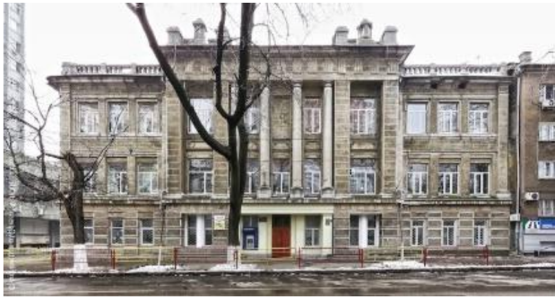
Рис. 2. Фасад по Великій Арнаутській

Після революції на базі гімназії була створена трудова школа № 48. У перші післявоєнні роки в будівлі розмістилися очний госпіталь і школа сліпих для дорослих, а в 1960-ті роки – середня школа №101 і школа робітничої молоді №16. З того часу будова свого профілю не змінювала і школа №101 вдало функціонує тут і донині. Таким чином, колишня гімназія М.С. Панченка входить до рахунку небагатьох одеських будинків, чия початкова (в даному випадку – освітня) функція ніколи не змінювалася, хоча за минуле століття тут квартирувало чимало навчальних закладів.