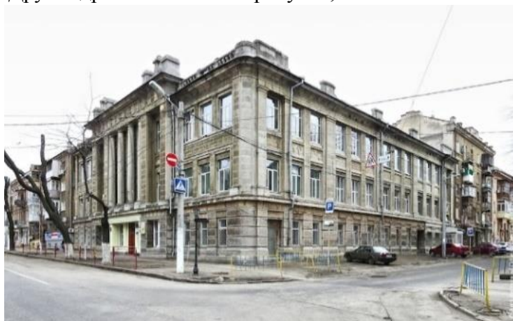
Рис. 1. Загальний вигляд будівлі

Тип будівлі: будівля освітнього призначення. Стиль: модернізований неокласицизм, ретроспективний модерн. Архітектор проекту: К.К. Абт. Інженер проекту: К.М. Добровольський. Дата будівництва: 1911-1914 рр. Статус: пам'ятка архітектури місцевого значення. Друга адреса: Канатний провулок, 1.