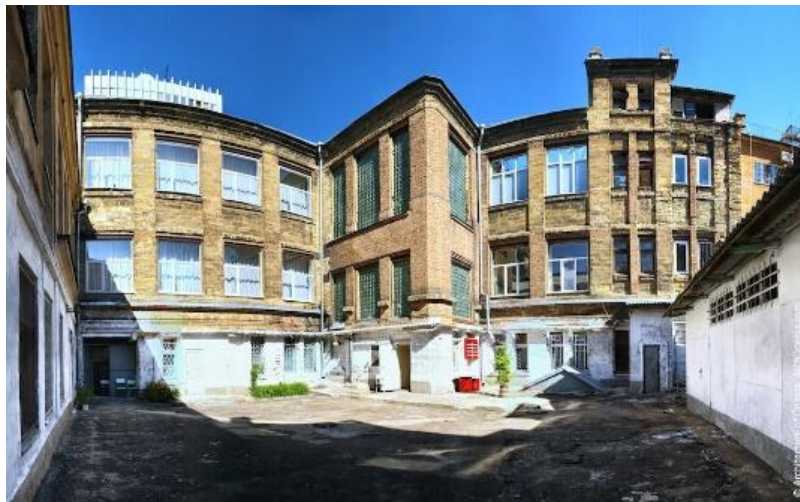
Рис. 8. Дворовий фасад

технічних приміщень (за таким принципом реалізовані вікна першого поверху у всіх крилах), причому друга від краю вісь завершується кубічним антресольним обсягом висотою в повноцінний поверх. Фасад дворового (службового) крила аналогічний тильному фасаді крила з Канатного провулку.