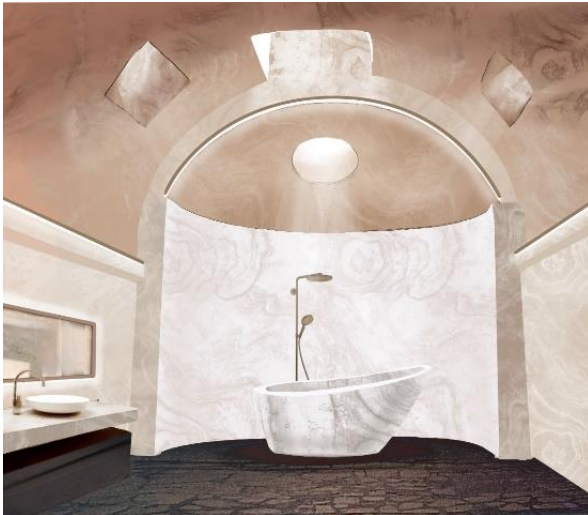
Рис. 3. Ванна кімната на основі давньоримських терм

Ванна кімната в стилі римських терм. На рис. 3 представлено мінімалістичну ванну кімнату, натхненну Кальдарієм терм Форуму (рис. 4). Стіни, ванна та стільниця виконані з мармуру; ванна має спрощену форму давньогрецького; раковина відсилає до давньогрецького лутеріону; в декоруванні використано велике в бронзовій рамі, що також є дуже характерним елементом стилю мінімалізм. Проект ванної кімнати також має свою екологічну особливість: я залишила отвори в стелі, що помітні на першоджерелі, щоправда маючи в плані скління. Така система природного освітлення дозволить економити електроенергію вдень. Для нічного часу або більшої освітленості я передбачила світлодіодні елементи освітлення, розташовані вздовж стін та на арці, дзеркало також має підсвічування.