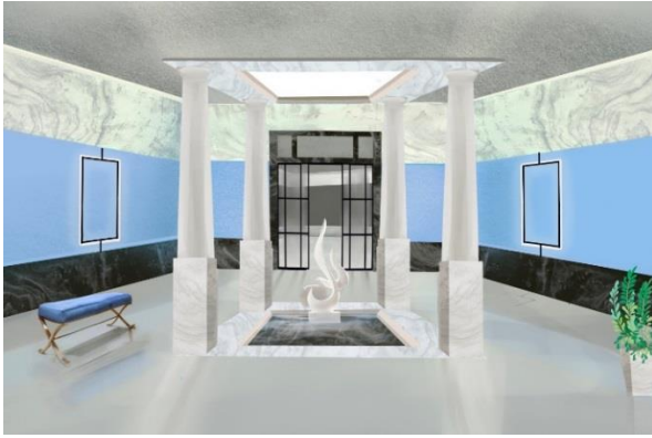
Рис. 1. Дизайн сучасного атриуму