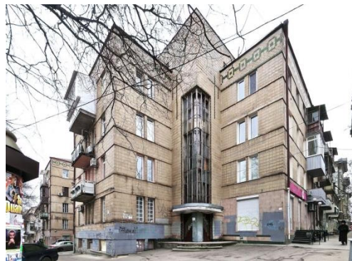
Рис. 2. Сучасний вигляд

Не уникнула добудов будівля колишньої АТС – вул. Катерининська, 37/41. Слід зазначити, що архітектори добудованої кав'ярні намагались зберегти рівні лінії та прямі