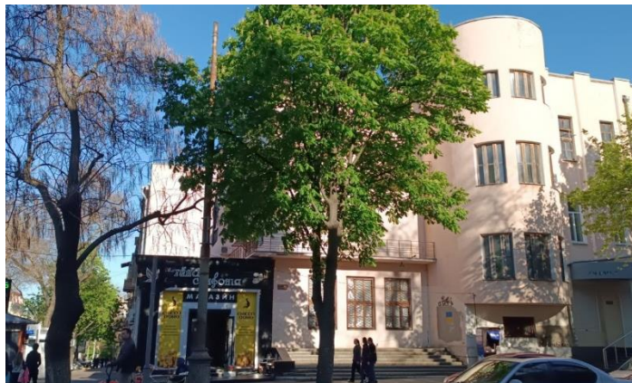
Рис. 3. будівля колишньої АТС – вул. Катерининська, 37/4

кути, що властиві первинному вигляду споруди, але вони порушуються криволінійним декором (скрипковий ключ). Дизайнери кафе досягли того, що завдяки яскравим кольорам фасаду воно виділяється на загальному фоні будівлі, але це порушує первісний задум архітектора (рис. 3).