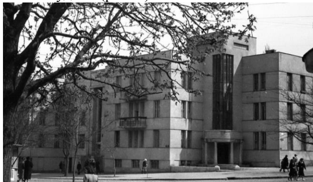
Рис. 1. Будинок Радторгфлоту, пров. Маяковського, 9, 1950-ті рр. (до облицьовання)

За результатами нашого дослідження було з'ясовано, що добре зберігся та уникнув добудов будинок Радторгфлоту – пров. Маяковського, 9 (в 2009 році будівля була взята під охорону держави як пам'ятка архітектури та містобудування), але первісний вид фасаду все ж таки зазнав втручання. У часи будівництва фасади будинку були пофарбовані в світло-пісочний колір, призматичні об'єми будівлі за задумом архітектора поділялися по висоті горизонтальними смугами коричневого відтінку (рис. 1), але в наші часи вони облицьовані одноманітною керамічною плиткою, що створює непотрібний ритм та порушує зорове сприйняття будівлі (рис. 2).