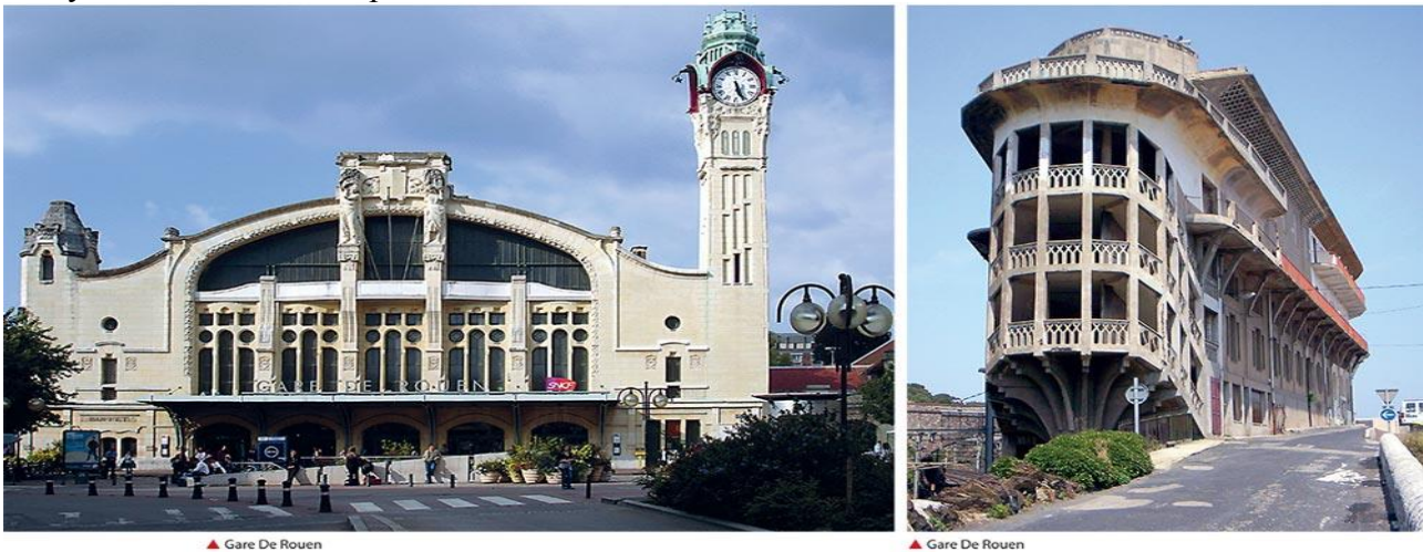
Рис. 1. Ар деко. Французька формула розкоші

У ці роки архітектори почали використовувати більш передові та екологічно чисті матеріали, такі як перероблені та стійкі матеріали, а також смарт-матеріали, що реагують на зміну навколишнього середовища.