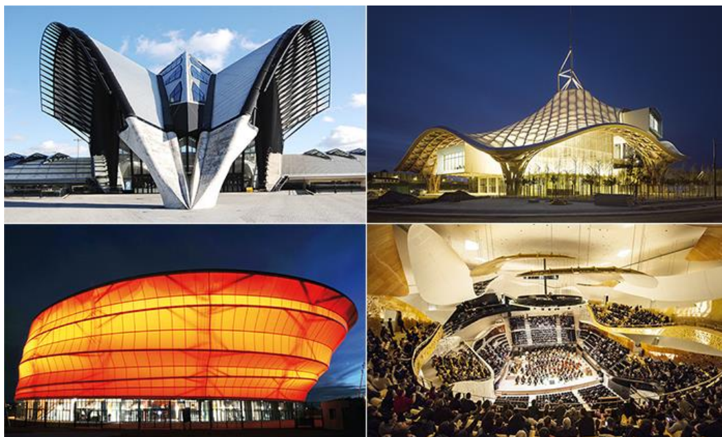
Рис. 3. Архітектура Франції періоду 21 століття

4. Цифрові технології: французькі архітектори також досліджують використання цифрових технологій в архітектурі, включаючи використання параметричного дизайну, віртуальної реальності та 3D-друку. Приклади включають офісну будівлю Porte de Montreuil у Парижі від Chartier Dalix, яка має параметричний дизайн фасаду, і цифровий павільйон від студії Ball-Nogues у Центрі Помпіду в Парижі.