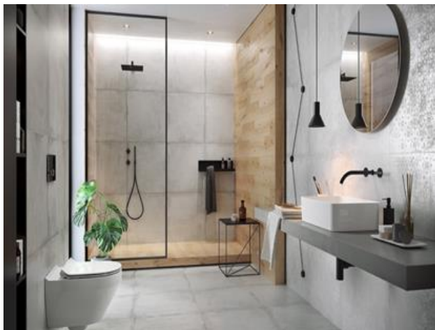
Рис. 11. Дитяча кімната в стилі мінімалізм

Щоб створити стиль мінімалізм в інтер'єрі, слід врахувати нюанси, яких не потрібно бути в такому дизайні. Якщо ви бажаєте мати квартиру або будинок, оформлений в мінімалістичному виконанні, то треба враховувати що мінімалізм дуже складно відтворити у маленьких кімнатах. Навіть якщо забрати декор і меблі, то простір не збільшиться, а буде здаватися порожнім. Цей стиль потребує великих панорамних вікон без фіранок, на меблях не повинно бути візерунків чи різьблених елементів. Від великої кількості яскравих кольорів, декоративних дрібничок, дешевих предметів меблювання слід відмовитися. А також краще створити практичне планування без перегородок [2].