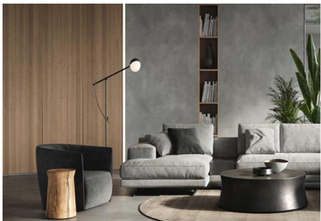
Рис. 3. Гармонічність та комфорт

практичні. Креативність вдало поєднується з гармонійністю, а загальна атмосфера сприяє розслабленню і отриманню задоволення (рис. 3).