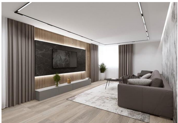
Рис. 7. Передпокій в стилі мінімалізм

Вітальня. Особливість оформлення вітальні – це відсутність зайвих меблів та дрібних предметів декору. Для зберігання речей пропонуються модульні шафи та приховані системи зберігання. На підлозі може бути однотонний килим, а на вікнах – лаконічні штори ( рис. 8). Щоб розбавити стиль мінімалізм у вітальні, можна використовувати цікаві акценти, такі як, картини або фотографії в простих рамках; ексклюзивні світильники, вази, скульптури, бажано виконані в суворих геометричних формах; оздоблення стін спеціальними фасадами [1].