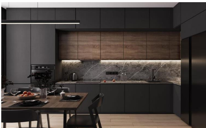
Рис. 9. Кухня в стилі мінімалізм

Спальня. Дизайн інтер'єру спальні в стилі мінімалізм дозволяє встановлювати у цій кімнаті тільки прості і практичні меблі. Це ліжко (бажано без підголів'я, балдахинів, інших аксесуарів і прикрас), вбудовану шафу з розсувними дверцятами і прилади освітлення (вбудовані, настінні, підлогові, підвісні). Все інше краще прибрати, якщо предмети інтер'єру не несуть функціонального навантаження (рис. 10). Вікно краще залишити без штор або з однотонними фіранками чи системою жалюзі [1].