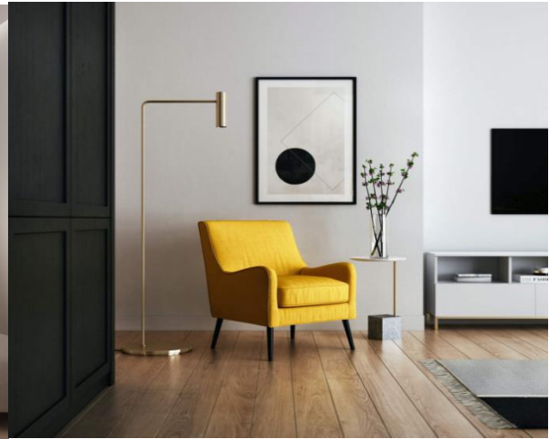
Рис. 2. Яскравий акцент в інтер'єрі

Існує декілька особливостей, за якими можна легко визначити мінімалізм в інтер'єрі. Характерними рисами цього стилю в дизайні приміщень є простота форм і меблів, свобода в просторі; багато світла, що забезпечується наявністю великих віконних отворів та значної кількості джерел освітлення; колірна гамма складається не більш, як з 2-3 контрастуючих між собою кольорів; наявність у дизайні геометричних фігур (кола, прямокутники, квадрати); невелика кількість декору, віддавання переваги великим елементам і аксесуарам (вази або скульптури); функціональність кожного елементу; використання натуральних матеріалів (деревина, камінь, скло, метал), має спокійну фактуру; меблі, які доповнюють мінімалізм, встановлюються і поєднуються таким чином, що начебто «розчиняються» у просторі; унікальні акценти, які не дозволяють стилю здаватися безликим, аскетичним чи стерильним (рис. 2) (арт-об'єкти, полотна, фотографії, картини, гобелени, розпис стін, великі годинники або інше) [2]. Також слід відзначити, що приміщення, оформленні в стилі мінімалізм, дуже комфортні і