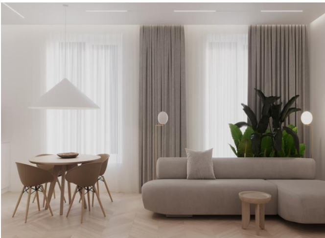
Рис. 1. Оформлення мінімалізму

Вступ. Мінімалізм в інтер'єрі – це багато простору, що насичений повітрям, світлом, мінімум декору, меблів і відсутність зайвих речей. Це спокійні базові кольори та прості форми з чіткими лініями (рис. 1.). Головне у ньому – гармонічне поєднання всіх компонентів інтер'єру. Цьому дизайну характерні стриманість і строгість в оформленні. Вона досягається за допомогою використання функціональних предметів інтер'єру, геометричності форм і поєднанням двох або трьох базових кольорів [3].