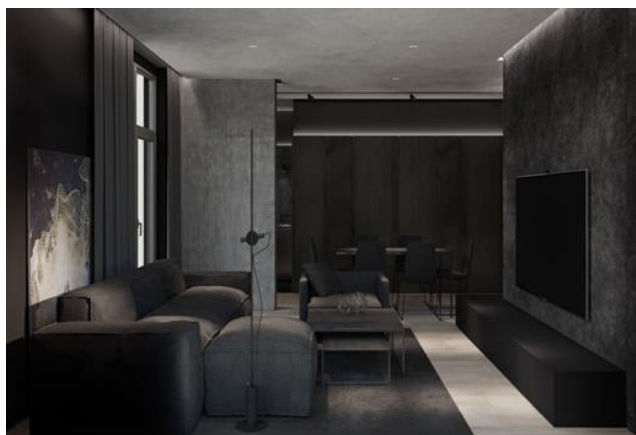
Рис. 4. Текстура і варіанти підсвічування

Інтер'єри в стилі мінімалізм. Сучасна концепція створення інтер'єрів в стилі мінімалізм, для досягнення більшої досконалості, доповнюється спокійним текстилем, різноманітним декором, теплими кольоровими рисами. Хоча основою стилю є контрастне поєднання класичних білих і чорних кольорів, гра з текстурою, формами, графікою, фактурою поверхонь, варіантами підсвічування завжди додає індивідуальності (рис. 4). Тому кімнати не виглядають суворо, а відображають захоплення і інтереси власника [3]. При створенні дизайну приміщень в стилі мінімалізм слід дотримуватися основних правил стосовно лаконічності і почуття міри (рис. 5). Велике значення має використання багатої кількості розсіяного світла. Для цього відмовляються від перегородок, маленьких вікон і приділяють увагу багаторівневному освітленню з використанням природних та штучних джерел. Колірна палітра інтер'єру складається з 2-х основних тонів, а третій підбирається у якості акценту. Стосовно меблів дотримуються наступних рекомендацій: плоскі однотонні фасади, без візерунків і фрезерування; чітка геометрія конструкцій; підвищена функціональність; використання підвісних елементів; дотримання прийнятої в інтер'єрі кольорової палітри. В якості матеріалів для м'яких меблів використовується однотонний текстиль чи шкіра (рис. 6). Кольори оббивки спокійні, а акцент можна зробити, наприклад, на яскравих декоративних подушках [2].