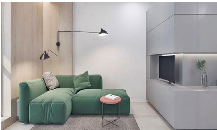
Рис. 5. Лаконічність форм

Інтер'єри в стилі мінімалізм. Сучасна концепція створення інтер'єрів в стилі мінімалізм, для досягнення більшої досконалості, доповнюється спокійним текстилем, різноманітним декором, теплими кольоровими рисами. Хоча основою стилю є контрастне поєднання класичних білих і чорних кольорів, гра з текстурою, формами, графікою, фактурою поверхонь, варіантами підсвічування завжди додає індивідуальності (рис. 4). Тому кімнати не виглядають суворо, а відображають захоплення і інтереси власника [3]. При створенні дизайну приміщень в стилі мінімалізм слід дотримуватися основних правил стосовно лаконічності і почуття міри (рис. 5). Велике значення має використання багатої кількості розсіяного світла. Для цього відмовляються від перегородок, маленьких вікон і приділяють увагу багаторівневному освітленню з використанням природних та штучних джерел. Колірна палітра інтер'єру складається з 2-х основних тонів, а третій підбирається у якості акценту. Стосовно меблів дотримуються наступних рекомендацій: плоскі однотонні фасади, без візерунків і фрезерування; чітка геометрія конструкцій; підвищена функціональність; використання підвісних елементів; дотримання прийнятої в інтер'єрі кольорової палітри. В якості матеріалів для м'яких меблів використовується однотонний текстиль чи шкіра (рис. 6). Кольори оббивки спокійні, а акцент можна зробити, наприклад, на яскравих декоративних подушках [2].