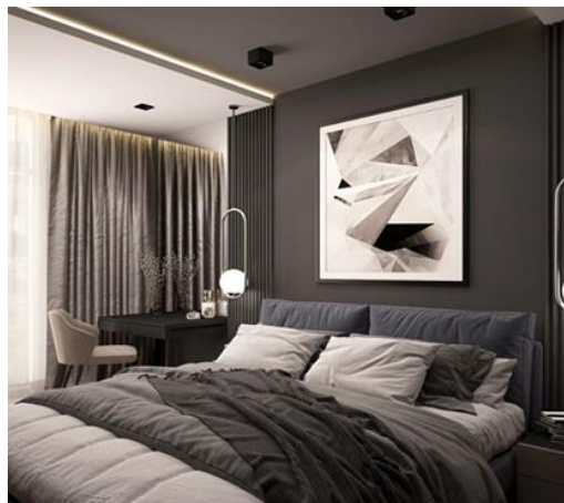
Рис. 6. М'які меблі та текстиль

Передпокій. При бажанні в оформленні передпокою можна застосовувати дзеркала і прилади освітлення, щоб візуально збільшити простір. Стіни фарбуються в теплі кольори або оклеюються фактурними шпалерами, які не мають малюнків (рис. 7). Для оздоблення підлоги використовується плитка світлих тонів. Шафа для одягу може мати розсувні дверцята з дзеркальними поверхнями [1].