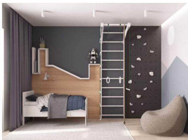
Рис. 12. Ванна кімната в стилі мінімалізм

Висновки. Якщо стиль мінімалізм правильно витриманий, то він не буде здаватися сухим або нудним, стерильним чи суворим. Дизайн будинку в такому стилі стане повним відображенням природи власника, зробить атмосферу вільною, більш затишною і одночасно вишуканою.