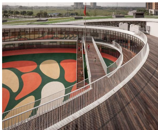
Рис. 14. Фрагмент атриуму. Будівля дитячого садка в районі Хуэйшань, Уси, Японія