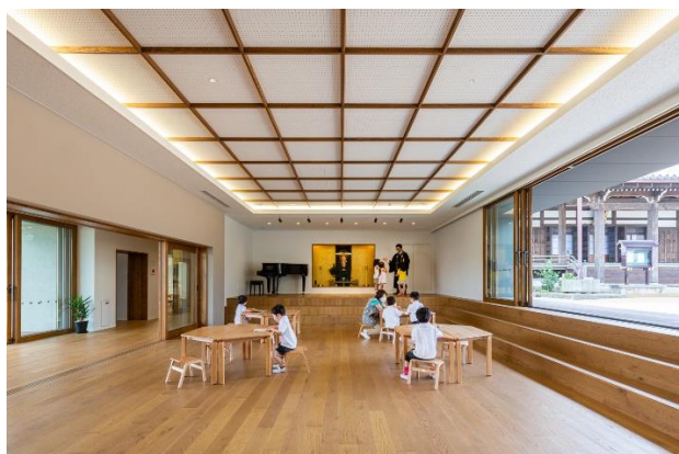
Рис. 9. Фрагмент інтер'єру. Дитячий садок в Аїті, Японія