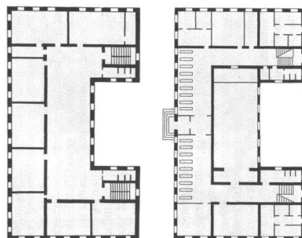
Рис. 2. Креслення типового плану дитячого садка