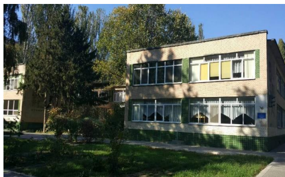
Рис. 4. Фрагмент фасаду. Дитячий садок, Одеса, Київський район