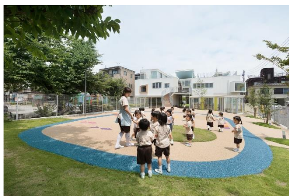
Рис. 17. Подвір'я дитячого садка Томонокі-Хімаварі, Японія