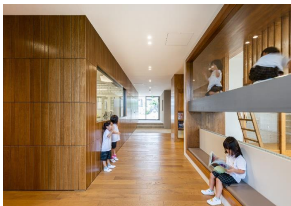
Рис. 10. Фрагмент інтер'єру. Дитячий садок в Аїті, Японія