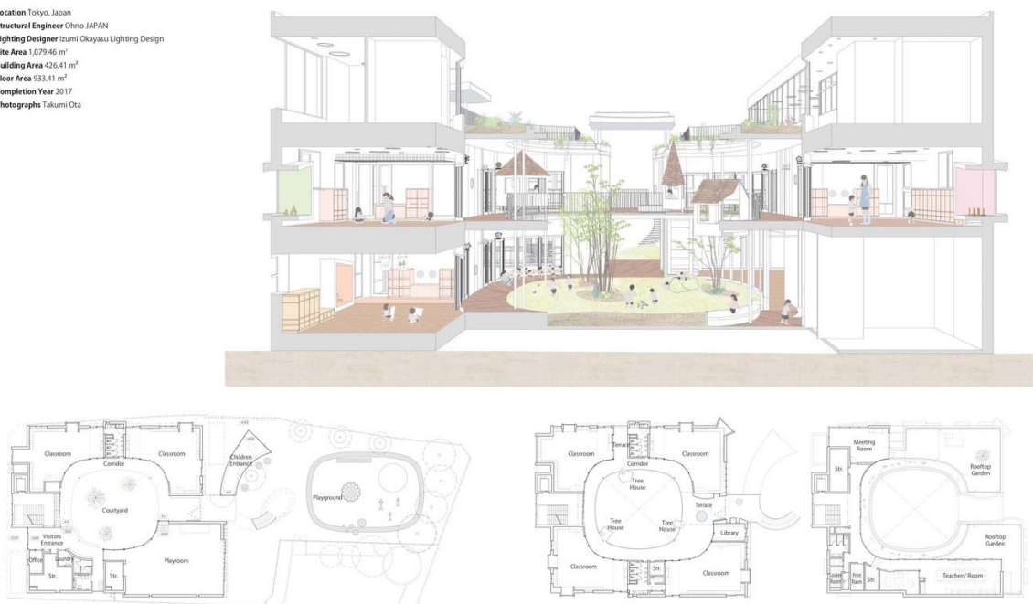
Рис. 18 Креслення планів та 3D переріз дитячого садка Томонокі-Хімаварі, Японія

Location Tokyo, Japan Structural Engineer Ohno JAPAN Lighting Designer Izumi Okayasu Lighting Design Site Area 1,079.46 m 2 Building Area 426.41 m 2 Floor Area 933.41 m 2 Completion Year 2017