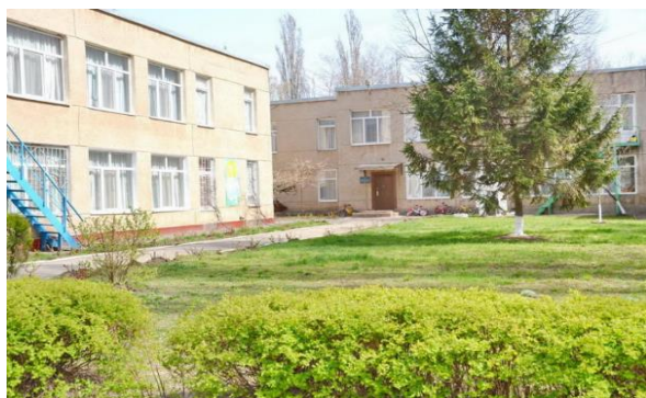
Рис. 3. Фрагмент типового фасаду дитячого садка