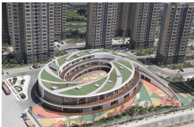
Рис. 13. Вид зверху. Будівля дитячого садка в районі Хуэйшань, Уси, Японія

Дитячий садок, спроектований UDG, розташований у житловому кварталі Xieli Garden, район Хуэйшань, Уси. Це триповерхова еліптична будівля у формі спіралі - кільця, яка призначена для створення ідеального навчального середовища, пов'язаного з відкритим простором і залитого сонячним світлом. Будівля має обтічну форму та динамічно вписується в існуючу систему прямих доріг (рис.13-15). Архітектурне моделювання безпосередньо впливає на лінію управління озелененням, так, що дитячий садок разом з торговим центром на заході та громадським центром на півдні утворює високоякісний, зручний квадратний простір, що підходить для прогулянок та відпочинку. У той же час, що стосується сторони, зверненої до дороги, архітектурна студія врахувала екранування транспортного шуму, і в проекті використовується трохи горбиста місцевість з ландшафтом зелених рослин, щоб тактовно відокремити дитячий садок від дороги, щоб ефективно зменшити вплив шуму вуличного руху у внутрішньому середовищі дитячого садка [13].