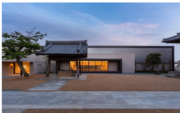
Рис. 8. Фрагмент подвір'я. Дитячий садок в Аїті, Японія.