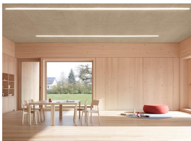
Рис. 12. Фрагмент інтер'єру дитячого садка в Енгельбаху, Австрія