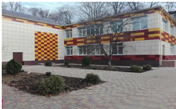
Рис. 6. Фрагмент фасаду дитячого садка Україна, м.Одеса, вул.Академіка Воробйова

Формування свідомості починається з дитинства. Сприйняття грамотно підібраних текстур, форм та кольорів впливає на здоровий розвиток дитини та задає фундамент, що звертає увагу не тільки на соціальний аспект дитячих садків, але й на естетичний.