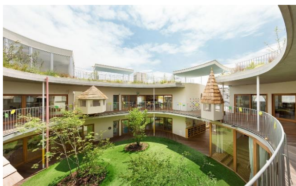
Рис. 16. Фрагмент атриуму дитячого садка Томонокі-Хімаварі, Японія

було вирішено заздалегідь, щоб дати вчителям та дітям свободу користуватися та використовувати простір так, як їм вигідно. Як дизайнери студія може оцінювати те, як змінюються простори для людей, які їх використовують. Щоб ще більше стимулювати та збагатити дитячу чутливість, вся споруда висаджена у тривимірному вигляді, щоб показати чотири сезони та зміни у рослинності. Оскільки природа змінюється в залежності від пори року, комахи та птахи, яких приваблює рослинність, можуть бути цікаві дітям та їхнім батькам. Натхненні цим оточенням, природні мотиви, такі як комахи, дерева, заховані всередині та навколо будівлі у вигляді візерунків та предметів, так що діти можуть насолоджуватися простором, постійно відкриваючи для себе щось нове [14].