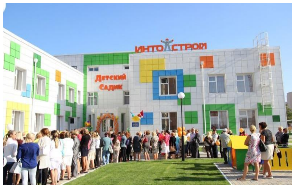
Рис. 5. Фрагмент фасаду дитячого садка. Україна, м.Одеса, вул. Марсельська

Малими бюджетами місцева влада домагається апгрейду застарілої радянської архітектури дошкільних закладів, що призводить до хаотично розфарбованих, нецілісних фасадів із підсистеми на основі металевих касет (рис.5, рис. 6).