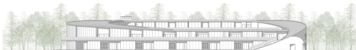
Рис.15 Креслення фасаду дитячого садка в районі Хуэйшань, Уси, Японія

Дитячий садок Томонокі-Хімаварі, розташований в районі Аракава в Токіо, являє собою нещодавно створений приватний дитячий садок місткістю 175 осіб. Оскільки місцеве середовище густо населене будинками і фабриками, студія прагнула створити простір, яке сприяло розвитку розуму і тіла дітей, і де вчителі і діти могли б почуватися оточеними природою. Для цього вони розташували класні кімнати та ігрову кімнату так, щоб вони оточували пишній, зелений, залитий світлом сад, щоб створити внутрішній двір, що веде всередину (рис.16-18). Щоб відповідати змінам у розвитку дітей, студія створила різноманітні простори, такі як класи з різною висотою стелі, ігрові будиночки, підвішені над двором, та відкриті коридори, які мають петлю та різну ширину, щоб у дітей було безліч просторів для ігор та відпочинку. Крім того, використання кожного простору не