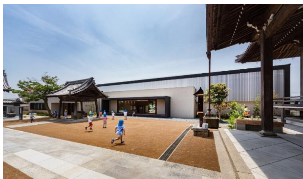
Рис. 7. Фрагмент подвір'я. Дитячий садок в Аїті, Японія