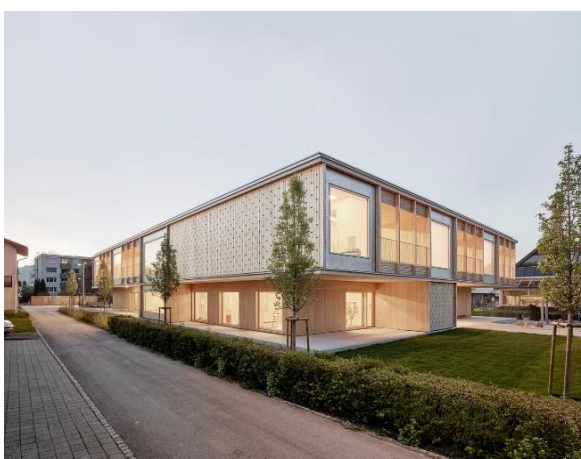
Рис. 11. Фасад дитячого садка в Енгельбаху, Австрія