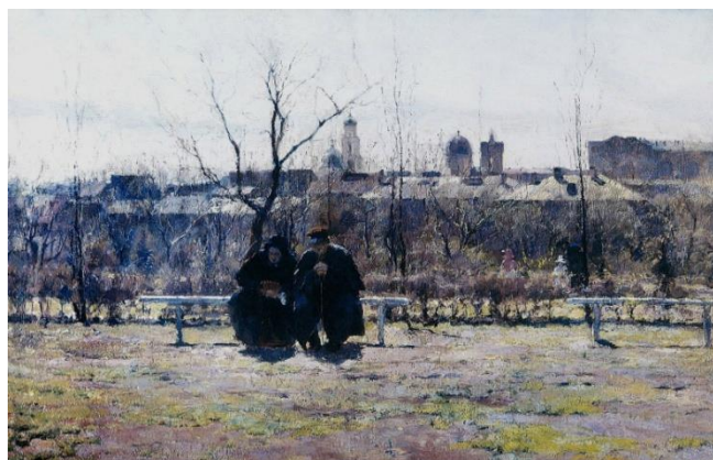
Рис. 2. «Старички» Кириак Костанди, 1890 год (південна реалістична школа)

Швейцарський теоретик та історик мистецтва Генріх Вельфлін ще наприкінці XIX століття, аналізуючи базові художні стилі та школи, тісно пов'язував їх виникнення з поняттям «психологія епохи»: його форми говорять своєю мовою те саме, що й інші складові його часу». Багатовіковий досвід та розвиток, етнічне різноманіття, національні інтереси, культура та мова, приємність традицій поколінь лежать в основі формування народів упродовж епох. Саме за цими базовими принципами ми визначаємо свою ідентичність. І саме вона стає заручником глобалізації сучасної епохи.