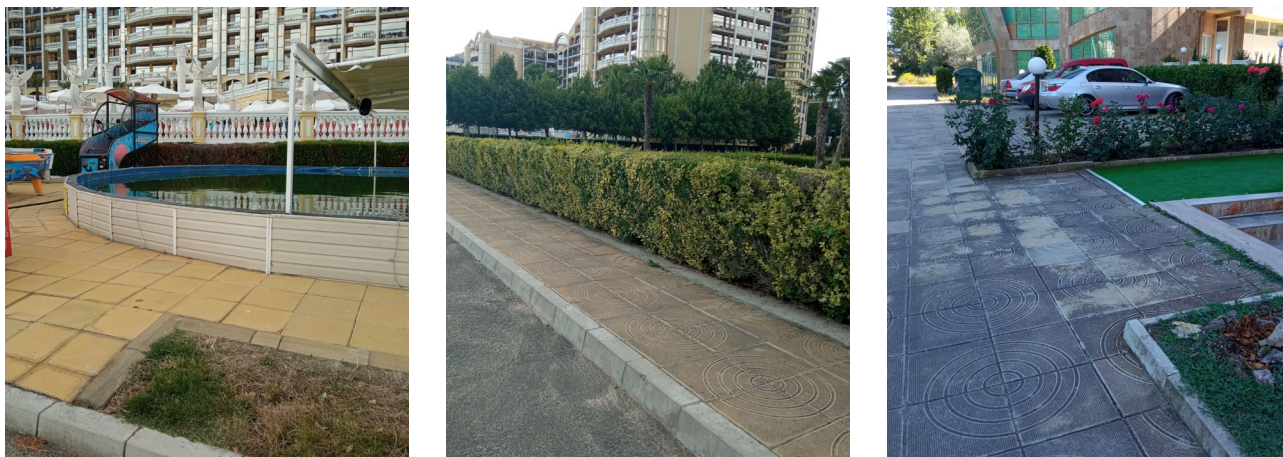
Рис. 3. Використання застарілого покриття з плит на тротуарах біля готелів та апартаментів на Сонячному березі (громада Несебр, Болгарія)

Не надає привабливості населеним пунктам і факт розташування один до одного покриттів з ФЕМ, виготовлених в різних стилях (різних узорів та матеріалів) (рис. 4).