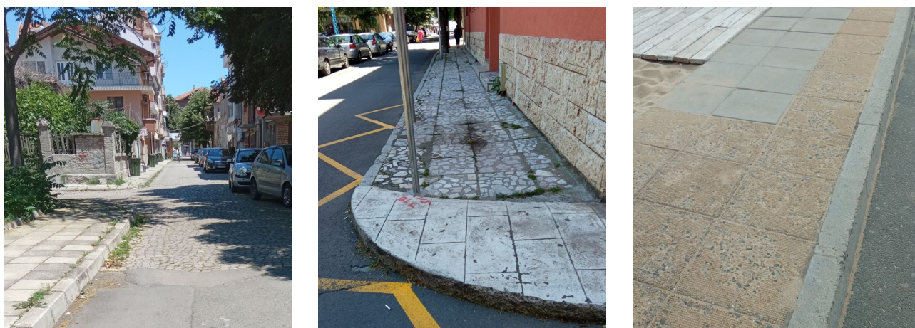
Рис. 4. Використання поруч застарілого пошкодженого покриття з різних матеріалів та узорів

Не надає привабливості населеним пунктам і факт розташування один до одного покриттів з ФЕМ, виготовлених в різних стилях (різних узорів та матеріалів) (рис. 4).