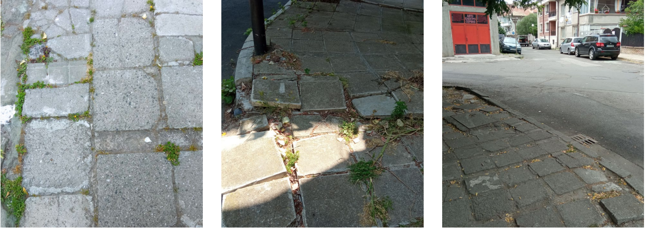
Рис. 1. Ділянки зі зруйнованими покриттями на вулицях Царь Арсен, Хаджи Димитр та Солна у м. Поморіє, Болгарія

Болгарії: Несебр, Поморіє та Сонячний берег (громада Несебр). При огляді покриттів на вулицях цих міст спостерігались наступні пошкодження: тріщини та ушкодження кромки окремих плиток, зсув елементів відносно їх початкового положення, збільшені шви між плитками, великий перепад по висоті між сусідніми елементами, відсутність окремих плиток в покритті, нахили плиток, наявність рослинності у швах між ними (рис. 1).