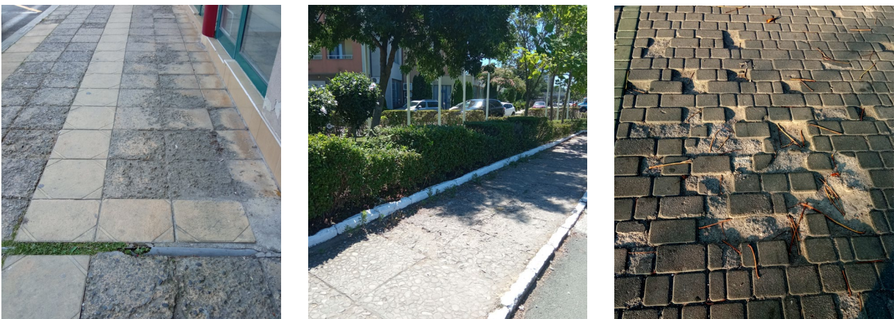
Рис. 2. Руйнування верхнього шару окремих елементів на вулицях Поморія (Болгарія), Сонячного берега (Болгарія) та Одеси (Україна)

В деяких місцях можна побачити руйнування верхніх шарів плиток (рис. 2), що не додає привабливості населеному пункту.