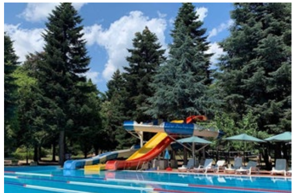
Рис. 4. Міжнародний дитячий спортивний табір РОСІЦА на курорті Св. Константин и Елена, Болгарія

У сучасній Україні архітектура оздоровчої галузі розвивається недостатнім темпом. Основні структурні елементи оздоровчої архітектури, якими є: курортні готелі, пансіонати, дитячі табори, центри здоров'я, морально та фізично застаріли.