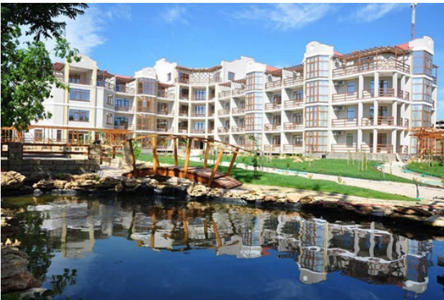
Рис. 13. Дитячий табір «Шоколад», пмт Сергіївка, Одеська область

Однак в реалії, на розглянутій території переважають зруйновані будівлі таборів, пансіонатів, які виставлені на продаж. Існують пропозиції щодо забудови центрів відпочинку рекреаційних територій житловими будинками підвищеної поверховості. В даний момент більшу частину землі викупили не тільки українські, а й зарубіжні чиновники [12]. Вони намагаються забудувати цей «ласий шматочок» особняками, дачами, забираючи всю прибережну зону. Безліч таборів, санаторіїв і баз відпочинку зараз або не експлуатуються, або просто знаходяться в не підлягають стані.