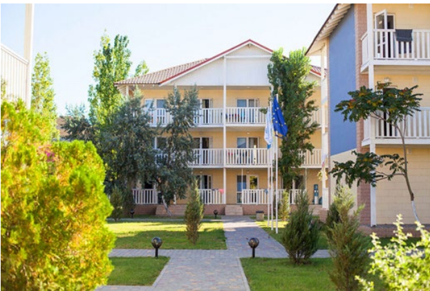
Рис. 15. Дитячий табір «Арт-Квест», Затока, Одеська область