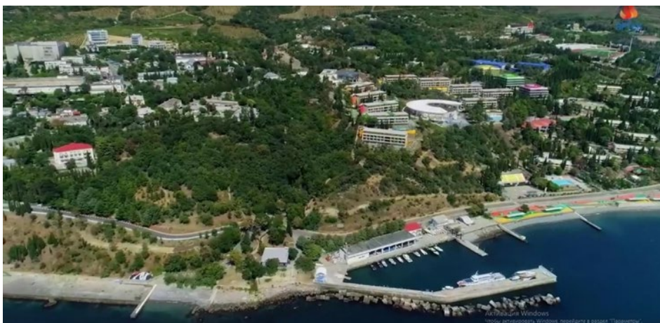
Рис. 5. Комплекс дитячих таборів відпочинку «Артек», Крим, Україна

У 1930 р. в Радянському Союзі втілювався в життя модний тренд будівництва санаторіїв, пансіонатів і дитячих таборів для народу. Відведене місце для рекреаційної зони виконувало поставлені цілі. Відпочиваючі приїжджали відпочивати з усього Союзу. На Великому Фонтані були засновані 17 дитячих таборів і санаторно-курортні закладів, 9 з яких зараз не функціонують.