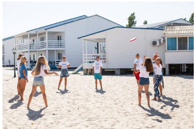
Рис. 16. Дитячий табір «Арт-Квест», Затока, Одеська область

Висновки. В Одеському регіоні в даний час функціонують 17 ДОЛ, 3 дитячі санаторії і тимчасово-організовані тематичні табори. Питання студентського відпочинку знаходиться в стадії вивчення.