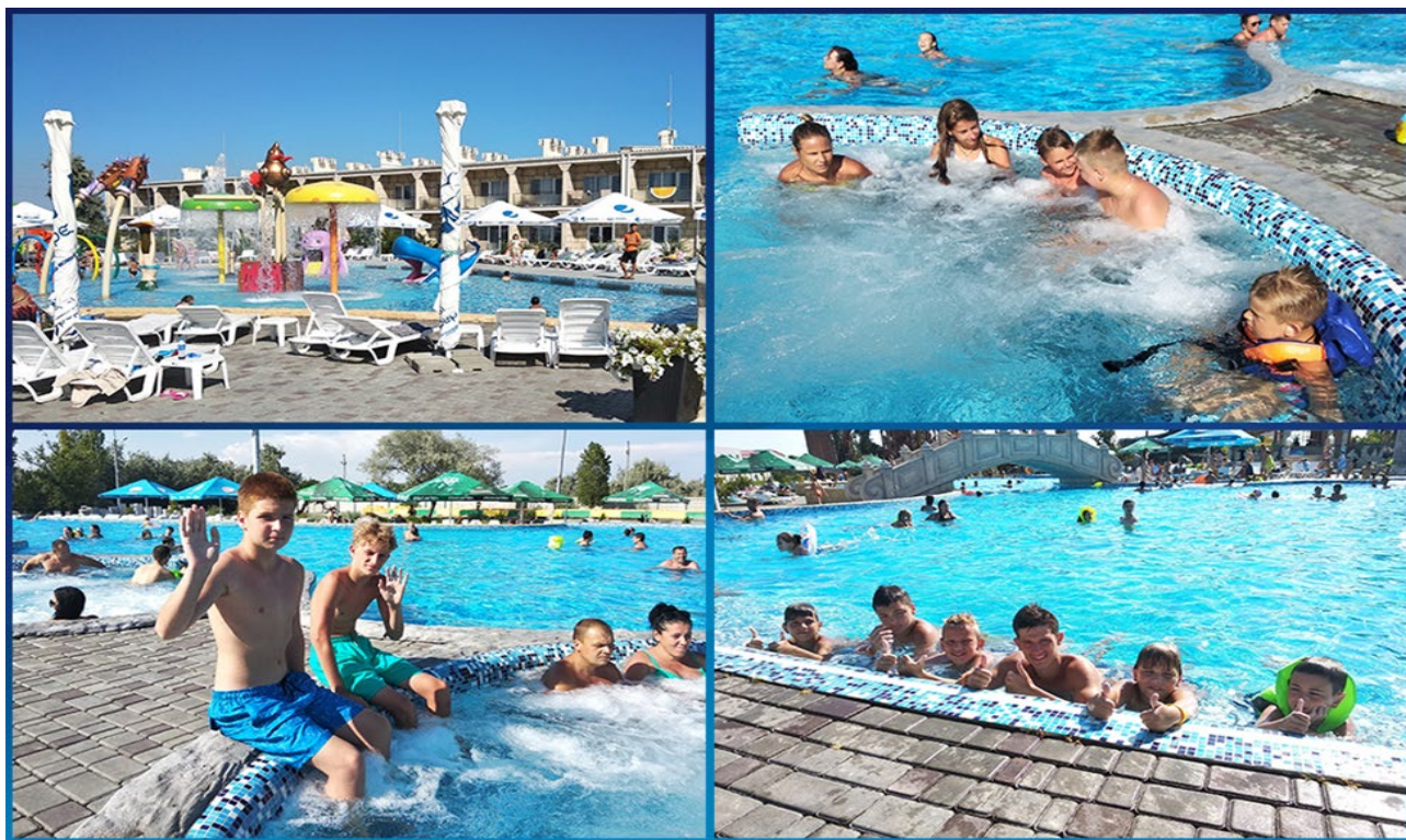
Рис. 12. Дитячий табір «Аквапарк», Затока, Одеська область

Одеський регіон має унікальні природно-кліматичні умови: наявність моря, степове повітря, дубовий та горіховий гаї, катакомби і природні цілющі джерела, що є основою для розвитку туризму і відпочинку. Головна проблема його розвитку – це відсутність розвинутої інфраструктури. Тут необхідно розвиток певної інфраструктури: будівництво мережі готелів, будинків відпочинку, пансіонатів, багатофункціональних комплексів з різноманітними видами послуг (розважальних, спортивних, оздоровчих) (рис. 12–16) [10].