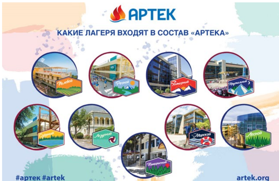
Рис. 6. Табори, які входять до комплексу «Артек», Крим, Україна

Після розпаду СРСР, санаторії та пансіонати стали руйнувати, частина територій викупили приватні особи. Ситуація змінилася далеко не на користь простих пострадянських громадян. Вулиця Дача Ковалевського почала обростати солідними особняками, огороженими значними парканами – як і інші вулиці на Великому Фонтані [8]. Не функціонуючи санаторно-курортні заклади знаходяться в занедбаному і зруйнованому стані, частина з них частково або повністю забудована житловою забудовою. Ділянки знаходяться ближче до меморіалу 411 батареї виставлені на продаж. Ще однією чимало важливою проблемою, є забудова ділянок санаторіїв житловими комплексами. (рис. 7).