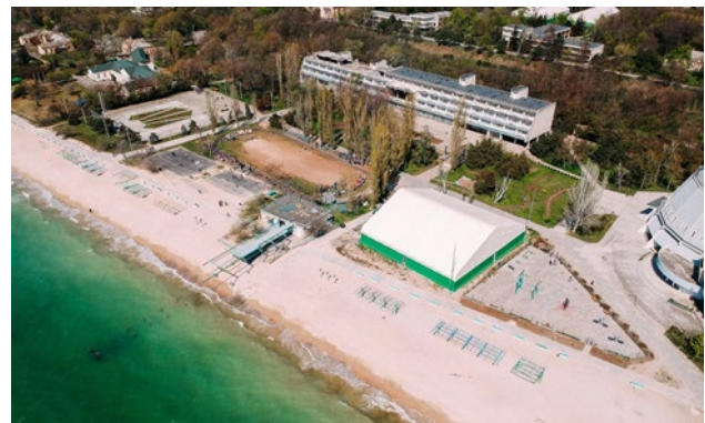
Рис. 8. Генеральный план комплексу таборів «Молода гвардія», Одеса