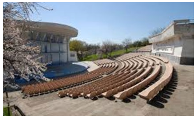
Рис. 10. Культурний центр із школою. «Молода гвардія», Одеса