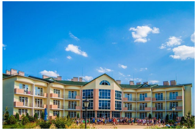
Рис. 14. Дитячий табір «Романтик», Скадовськ, Херсонська область