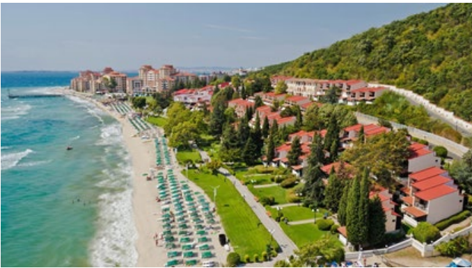
Рис. 1. Royal Holiday Camp (2010-2023 роки) на базі комплексу Еленіте, Болгарія