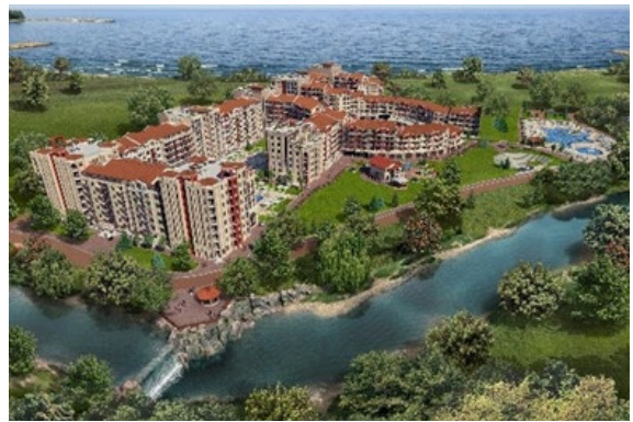
Рис. 2. Дитячий табір Мандарін, Болгарія, Ахелой