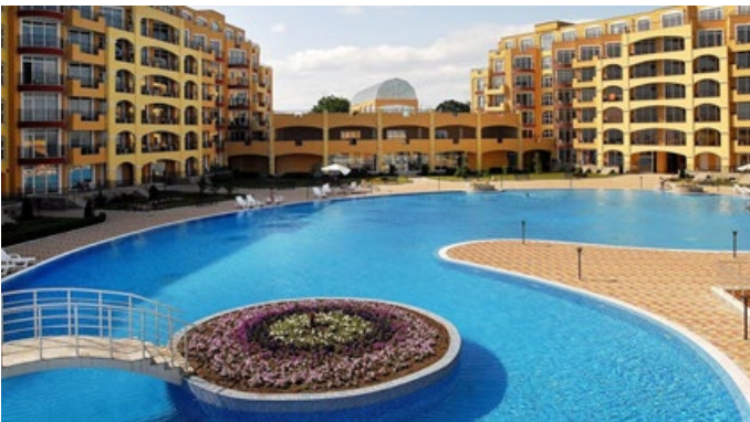
Рис. 3. Дитячий табір Midia Grand Resort, Болгарія