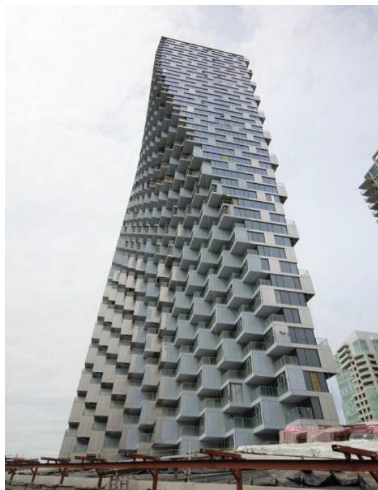
Рис. 3. Житловий комплекс «Vancouver House», Ванкувер, Британська Колумбія, Канада. Арх. Б'ярке Інгельс (BIG)