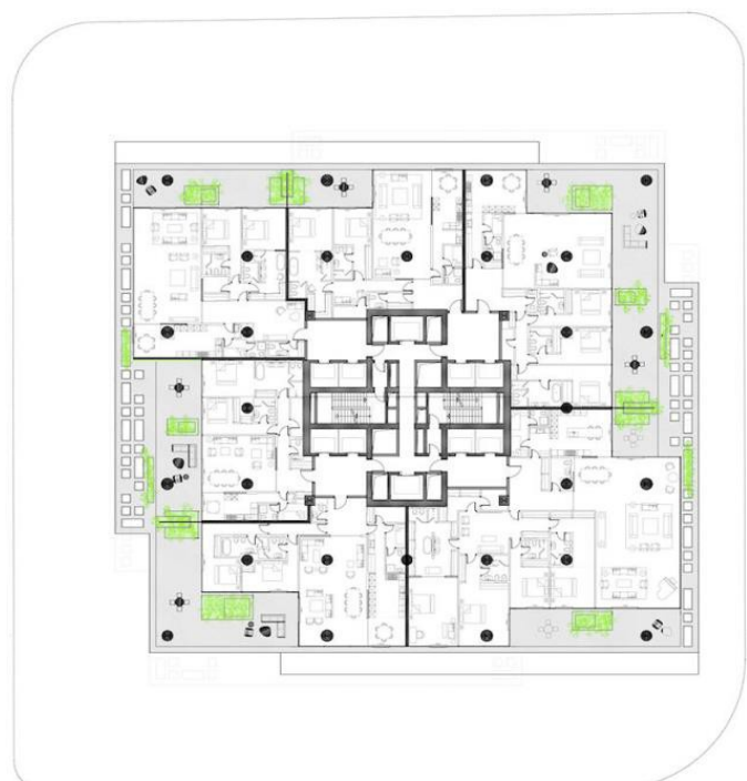
Рис. 2. Житловий комплекс «Beirut Terraces», Бейрут, Ліван, «Herzog de Meuron Architekten»

Житловий комплекс «Vancouver House», Ванкувер, Британська Колумбія, Канада є неофутуристичний хмарочос в Ванкувері (рис. 3). Цей будинок був спроектований датським архітектором Б'ярке Інгельсом («Bjarke Ingels Group» – BIG). Дизайн заснований на