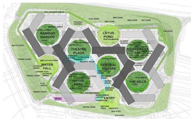
Рис. 1. Житловий комплекс «Interlace», Сінгапур, арх. О. Шерен