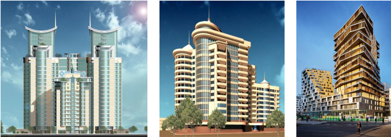
Рис. 4. Приклади проектних рішень сучасних багатоповерхових житлових будівель

Великий вплив на зовнішній вигляд багатоповерхівок зробила поява нових прогресивних фасадних систем, технології «вентильованих фасадів». Суцільне фасадне скління значно зменшує навантаження на несучі конструкції будівель та скорочує термін їх зведення. При цьому пластика фасадів стає більш виразною та монументальною (рис. 4).